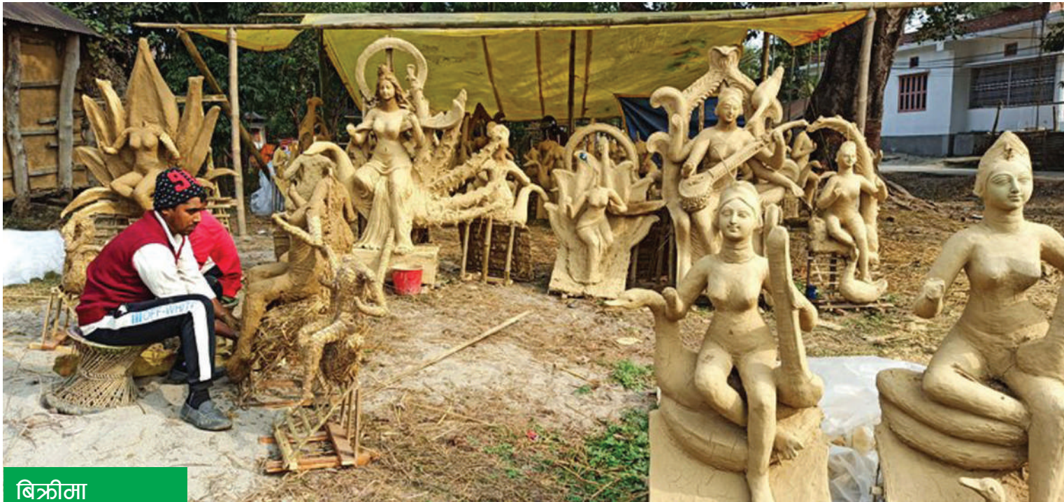
बिक्रीमा सरस्वतीको मूर्ति

सुनसरी सदरमुकाम इनरुवा-२ मा बिक्रीका लागि राखिएको सरस्वतीको मूर्ति ।