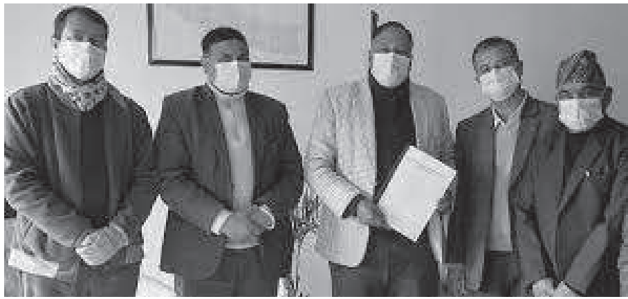
शिक्षकका लागि छुट्टै अस्पताल बनाउने घोषणा गरेका थिए। साथै, सोमबारको बैठकले केन्द्रीय शिक्षक अस्पतालको लागि अत्यावश्यक दरबन्दी स्वीकृत गरेको छ।