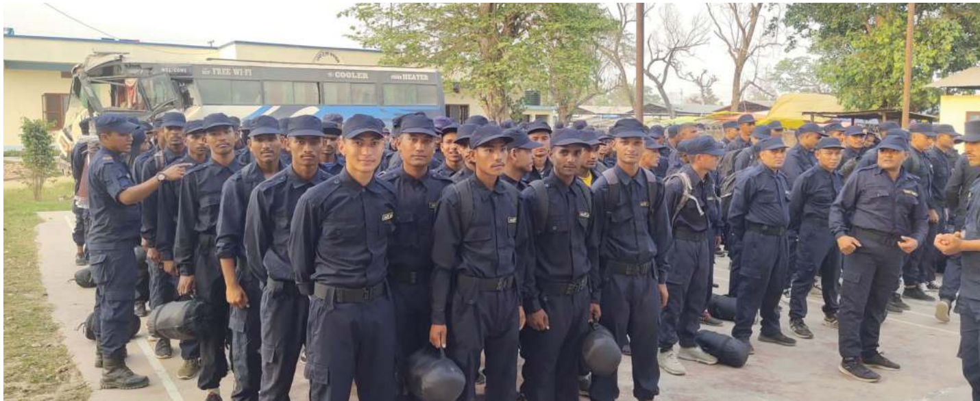
स्थानीय तहको निर्वाचनका लागि अर्का अर्का ठ्यादी प्रहरी बुधबार तालिम पश्चात् पोसाक लगाएर कार्यकर्तामा सजिए। काठमाडौं, १९ वैशाख २०७९