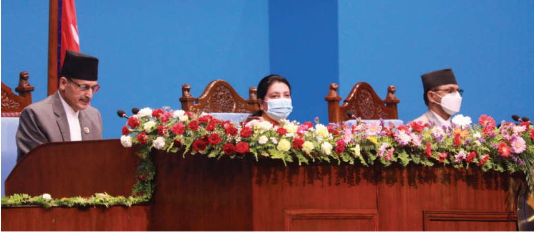
नारायण अर्वाल/मध्याह्न काठमाडौं, १० जेठ

■ राष्ट्रिय गौरव र रूपान्तरणकारी बाहेकका आयोजना प्रदेश तथा स्थानीय तहबाट गरिने