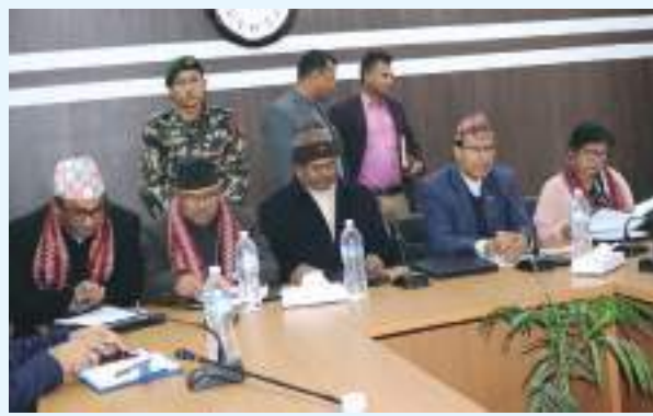
वैदेशिक रोजगार विशेष