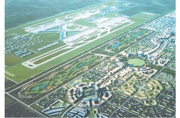
प्रस्तावित विजोड अन्तर्राष्ट्रिय विमानस्थलको स्केच

कान्ति न्यौपाने/मध्यान्ह काठमाडौं, १४ जेठ ।