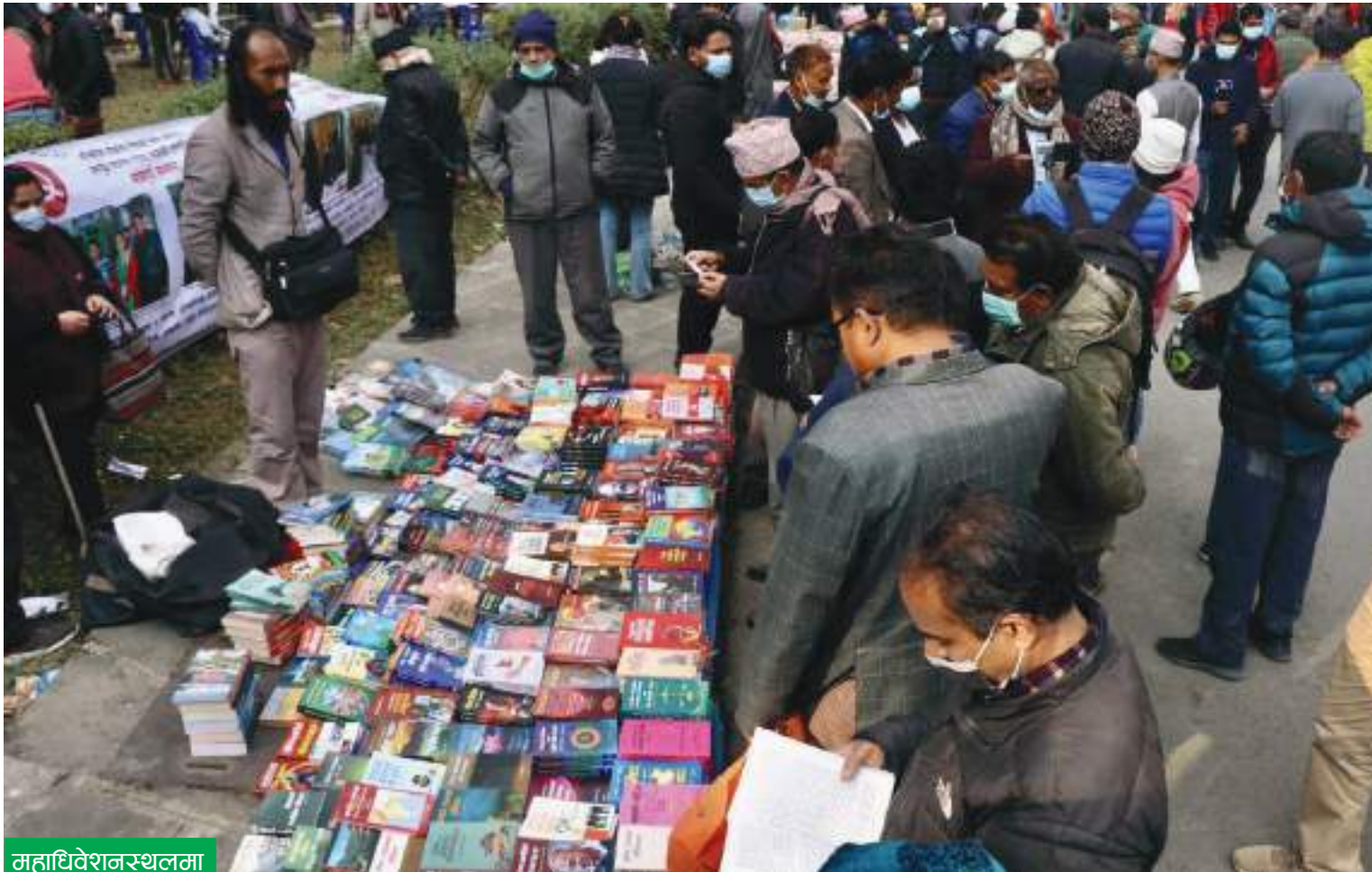
महाधिवेशनस्थलमा पुस्तक बिक्री गरिँदै

नेपाल कम्युनिष्ट पार्टी (माओवादी केन्द्र) को आठौँ राष्ट्रिय महाधिवेशनस्थल प्रज्ञाभवनको परिसरमा पुस्तक बिक्री गरिँदै ।