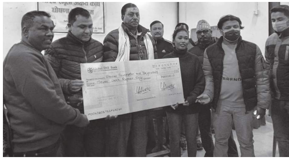
नेपालगन्ज, १३ पुस