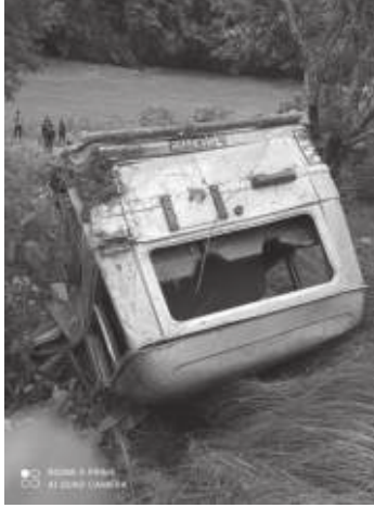
सागर भण्डारी/मध्याह्न गुल्मी, १३ साउन

गुल्मीमा जीप दुर्घटना हुँदा ३ जनाको मृत्यु भएको छ भने ७ जना घाइते भएका छन्। जिल्लाको चन्द्रकोट गाउँपालिका ४ शान्तिपुरबाट सदरमुकाम तम्घास आउँदै गरेको लु १ ज ४५५९ नम्बरको जिप मुसिकोट नगरपालिका ४ भड्याङमा दुर्घटना हुँदा ३ जनाको घटनास्थलमै ज्यान गएको हो।