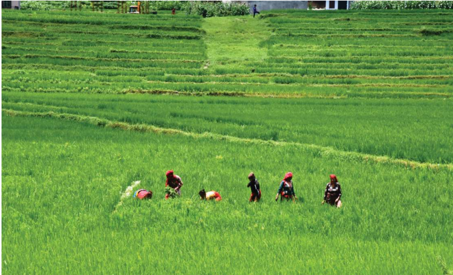
काभ्रेपलाञ्चोकको बनेपा-५ ढोकेचौरस्थित धान खेतभित्र क्यार उखेलदै किसान ।