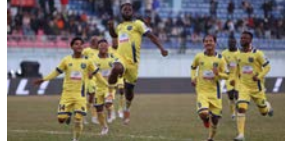
चितवनलाई पराजित गर्दै धनगढीलाई जित दिलाउन ओलावाले अफजले निर्णायक गोल

काठमाडौँ/मस- राजधानीमा जारी नेपाल सुपर लिग (एनएसएल) मा धनगढी एफसी पुनः शीर्ष स्थानमा उक्लिएको छ। त्रिपुरेश्वर स्थित दशरथ रंगशालामा बिहीबार भएको खेलमा चितवन एफसीलाई १-० गोल अन्तरले पराजित गर्दै धनगढी पुनः शीर्ष स्थानमा