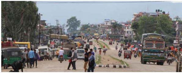
कुल्लेन् शही / मध्यान्ह सुर्खेत, २८ मंसिर

सुर्खेतमा पछिल्लो समय सवारी दुर्घटनाका घटनाहरू बढ्दै गएका छन् । ट्राफिक नियमका बारेमा आम नागरिकलाई जानकारी नहुँदा सुर्खेतको सडक अस्ुरीभत बन्दै गएको छ । वीरेन्द्रनगरमा बनेका नयाँ सडकहरूमा मात्रै ४६ वटा जेब्रा क्रसिङ रहेका छन् । ती जेब्राक्रसिङको प्रयोग भने भएको देखिँदैन । ट्राफिक कार्यालयले सर्वसाधारणहरूलाई हिँडुल गर्न सहज होस् भन्ने उद्देश्यले जेब्राक्रसिङ राखेपनि यसको बारेमा जानकारी नहुँदा उनीहरूले बीच सडकबाटै बाटो काट्ने गरेका छन् । यसले गर्दा प्रेश राजधानीसमेत रहेको वीरेन्द्रनगरमा दुर्घटनाको जोखिम बढ्दै गएको छ । मध्यान्ह राष्ट्रिय दैनिकका अनुसार वीरेन्द्रनगरमा सडकहरूमा ट्राफिक अवस्था कस्तो छ भनी बुबन सोमवार विर्सेको वीरेन्द्रनगरको मुख्य बजारहरू रहेको वीरेन्द्रनगर बजार, दैलेख रोड चोकहरूमा पुगेका थिए । हामी पुग्दा त्यहाँ पैदल यात्रुको आवतजावत निकै बढी थियो । दैलेख रोड चोकमा २ वटा जेब्राक्रसिङ बनाइएको छ । तर, पैदल यात्रुले ती जेब्राक्रसिङबाट भने बाटो कस गरेको देखिएन । उनीहरूले विच सडकबाटै बाटो कस गरेको भेटियो । विच सडकबाट बाटो पार गरेकी एक महिलांले आफू जेब्राबाटै यहाँ आएको कसरी बाटो काट्ने भन्ने बारेमा केही जानकारी नभएको बताए ।