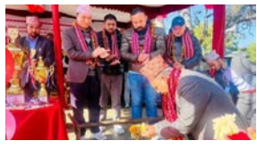
राजकुमार भुजेल/मध्यान्ह बैतेश्वर, २८ मंसिर

दो लखाको बैतेश्वर गाउँपालिकामा राष्ट्रपति रनिड शिल्ड प्रतियोगिता शुरु भएको छ। 'स्वास्थ्यका लागि खेलकुद, राष्ट्रका लागि खेलकुद' भन्ने मूल नाराका साथ पालिकामा बिहीबारदेखि बैतेश्वर गाउँपालिका अन्तर विद्यालयस्तरीय चौथो राष्ट्रपति रनिड शिल्ड प्रतियोगिता शुरु भएको हो।