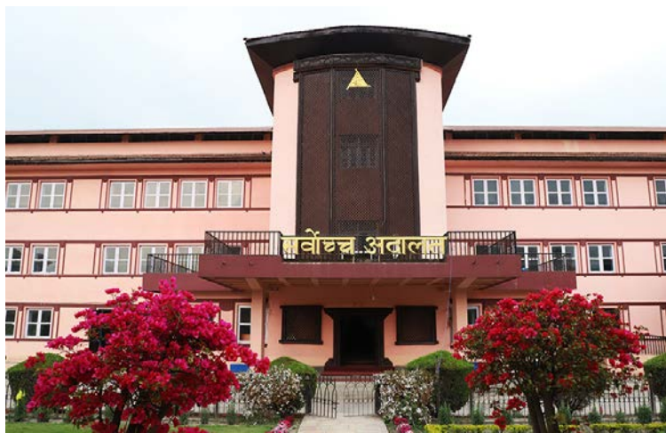
नेपालको संविधानको धारा २२८ को व्यवस्थासँग बाफिएको देखिँदा काठमाडौं