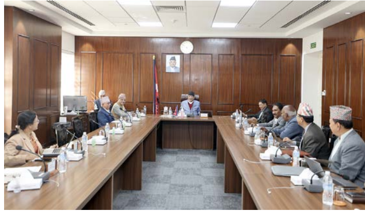
पनि व्यक्तिगत कारण देखाउँदै पदावधि सकिनु एक महिना अगावै राजीनामा