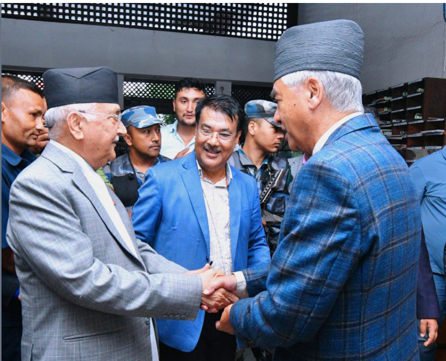
आफू नेतृत्वमा नयाँ सरकार बन्ने भएपछि नेपाली कांग्रेसको केन्द्रीय मुख्यालय सानेपा पुगेका एमाले अध्यक्ष केपी शर्मा ओली ।

नेकपा माओवादी केन्द्र ९ वर्षपछि प्रतिपक्षी भूमिकामा धकेलिएको छ । नेकपा एमालेले सत्ता समीकरण तोड्दै नेपाली कांग्रेससँग सहकार्य गर्न पुगेपछि माओवादी केन्द्रको भूमिका बदलिएको हो ।