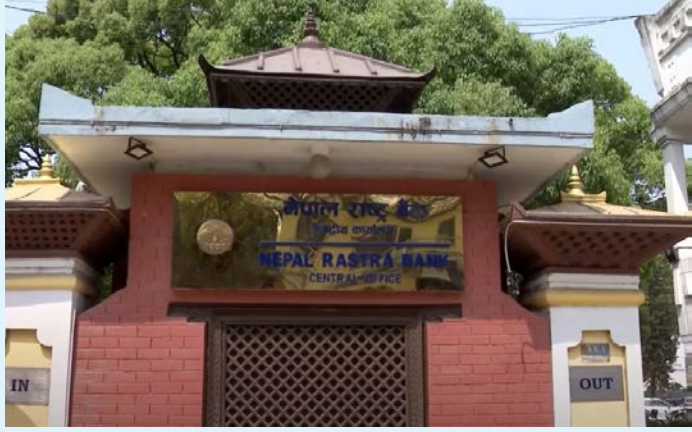
तुलनामा ऋण प्रवाहमा सुधार हुन नसकेको देखाएको छ । तथ्यांकअनुसार असार १६ गतेसम्म वाणिज्य बैंकहरूमा ५६ खर्ब १३ अर्ब निक्षेप संकलन भएको छ भने उनीहरूले सो समयसम्म ४५ खर्ब ५६ अर्ब मात्रै ऋण प्रवाह गरेका

बैंक तथा वित्तीय संस्थाहरूमा निक्षेपको आकार ६३ खर्ब नाघेको छ । तर, ऋण प्रवाह भने साढे ५१ खर्ब पनि पुग्न सकेको छैन । असार १६ गतेसम्म वाणिज्य बैंक, विकास बैंक तथा फाइनेन्स कम्पनीहरूमा ६३ खर्ब ३५ अर्ब ५९ करोड रुपैयाँ पुगेको नेपाल राष्ट्र बैंकले जनाएको छ । साथै सोही दिनसम्म वाणिज्य बैंक, विकास बैंक र फाइनेन्स कम्पनीहरूले मात्रै ५१ खर्ब ४९ अर्ब ऋण प्रवाह गरेका छन् । नेपाल राष्ट्र बैंकका अनुसार असार १५ गतेदेखि १६ गतेसम्म बैंकहरूमा आठ अर्ब निक्षेप थपिएको थियो भने लगानी भने ३ अर्बले मात्रै बृद्धि भएको थियो । जसले बैंकिङ क्षेत्रमा निक्षेपको