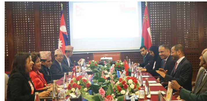
परराष्ट्रमन्त्री आरजु राणा ओमानका विदेशमन्त्री सइद बद्र अलबुसैदीसँग मंगलबार काठमाडौंको सोल्टी होटलमा भेटवार्ता गर्दै।

उनीहरूबीच भएको वार्तामा वार्तामा नेपालले हवाई कनेक्टिभिटी, श्रमसम्बन्धी विषय, लगानी, पर्यटन, कूटनीतिक आदानप्रदान एवं आवश्यक सबै प्रकारका सहयोग र समन्वयका विषयमा छलफल भएको छ। सोही क्रममा परराष्ट्रमन्त्री