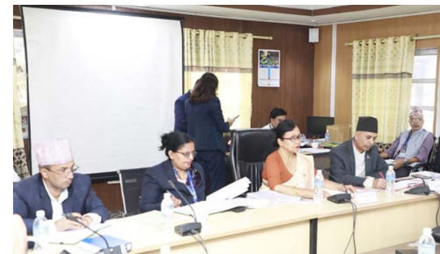
संसदीय सुनुवाइ समितिको मंगलबार सिंहदरबारमा बसेको बैठक।

राष्ट्रिय मानव अधिकार आयोगको अध्यक्ष वा सदस्य