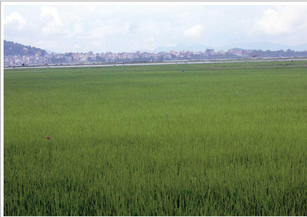
पहिलो साउन: पोखरा महानगरपालिका-१८ फेवाफोर्टमा हरियालीपूर्ण रैथाने जेठो बूढो धान। यस वर्ष मनसुन छिट्टै शुरु भएकाले किसानले धान जेठको पहिलो हप्तामै रोपेका थिए।