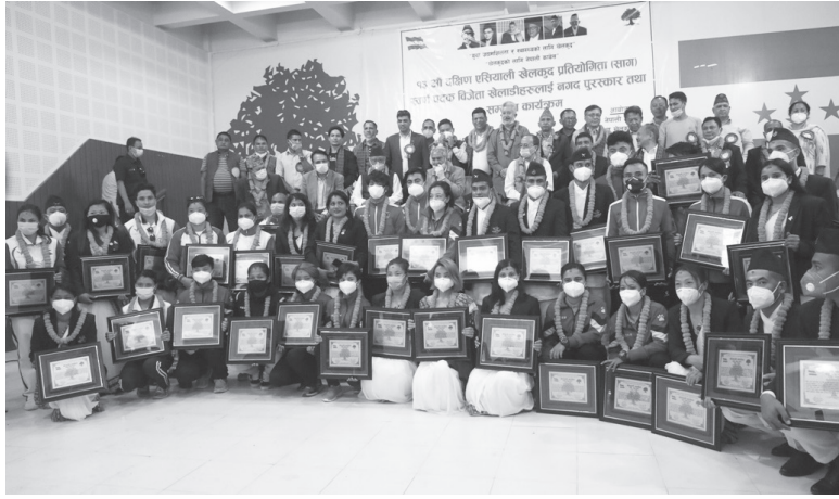
मध्याह्न संवाददाता काठमाडौं, १६ साउन

नेपाली कांग्रेस केन्द्रीय खेलकुद विभागले नेपालमा भएको १३ औं दक्षिण एसियाली खेलकुद (साग) मा स्वर्ण जित्ने खेलाडीलाई शुक्रवार नगदसहित सम्मान गरेको छ। १३ औं सागमा नेपालले व्यक्तिगत र टिम स्पर्धामा गरी विभिन्न १३ खेलमा एतिहासिक ५१ स्वर्ण जितेको थियो। ५१ स्वर्णसहित ६० र ९६ कांस्य जित्ने ७ राष्ट्र सहभागी १३ औं सागमा नेपालले दोश्रो स्थान हासिल गरेको थियो। १३ औं सागमा नेपालले हासिल गरेको उपलब्ध सागकै इतिहासमा अहिलेसम्मकै उत्कृष्ट हो। नेपालसँग १९९९ मा भएको आठौं दक्षिण एसियाली खेलकुदमा पनि नेपाल दोश्रो भएको थियो। त्यसिखेर नेपालले ३१ स्वर्ण, १० रजत