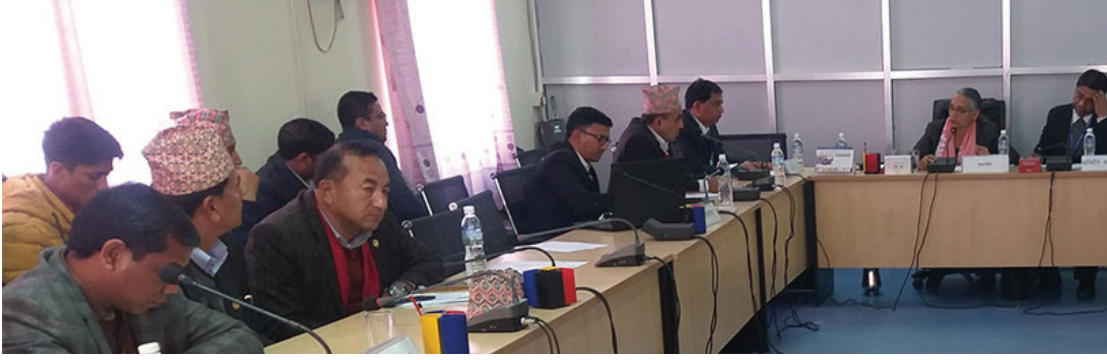
मध्यान्ह संवाददाता काठमाडौं, १६ साउन

प्रतिनिधि सभा अन्तर्गतको विकास तथा प्रविधि समितिले नेपाल टेलिकमको फोरजी सेवा विस्तार कार्य निर्धारित समयमा सम्पन्न हुन नसक्नुको कारण समितिमा उपलब्ध गराउन सरकारलाई निर्देशन दिएको छ। नेपाल टेलिकमको सेवा प्रभावकारिता सम्बन्धमा छलफल गर्न बसेको समितिको बैठकले टेलिकमको फोरजी सेवा विस्तार निर्धारित समयभित्र सम्पन्न हुन नसक्नुको कारण सात दिनभित्र समितिमा उपलब्ध गराउन सञ्चार तथा सूचना प्रविधि