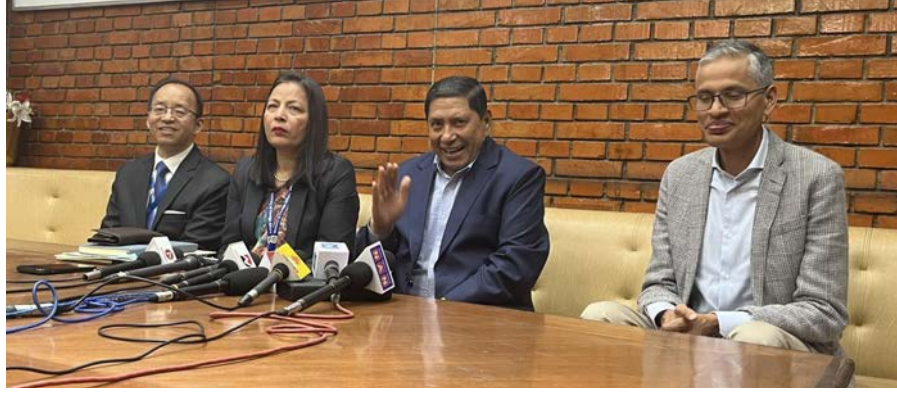
मध्यान्ह संवाददाता काठमाडौं, १९ चैत

उपप्रधानमन्त्री एवम् परराष्ट्रमन्त्री नारायणकाजी श्रेष्ठ चीन भ्रमण पूरा गरी स्वदेश फर्किएका छन् । उनी सात दिनको भ्रमण पूरा गरी सोमबार विहान स्वदेश फर्किएका हुन् । चिनियाँ कम्प्युनिष्ट पार्टी केन्द्रीय कमिटीका सदस्य तथा चीनका परराष्ट्रमन्त्री वाङ यीको निमन्त्रणाका परराष्ट्रमन्त्री श्रेष्ठ गत चैत ११ गते नेपाली प्रतिनिधिमण्डलको नेतृत्व गर्दै चीन भ्रमणमा गएका थिए ।