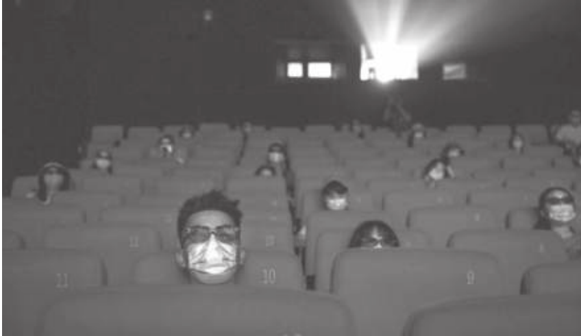
करीब ९ महिना बन्द भएर खुलेका हलहरू सरकारले तीन महिनामै फेरि बन्द करीब ५ महिना बन्द भएर यसपालीको दशैँबाट हलहरू

काठमाडौं/स- कोरोनाको तेस्रो लहर रोकथाम र नियन्त्रणका लागि नेपाल सरकारले सिनेमा हलहरू पुनः बन्द गर्ने निर्णय गरेको छ । आइतबार मन्त्रिपरिषदको बैठकका निर्णय सार्वजनिक गर्दै सञ्चार तथा सूचना मन्त्री ज्ञानेन्द्रबहादुर कार्कीले माघ १५ गतेसम्म हलहरू सञ्चालन गर्न नपाउने बताएका हुन् । सरकारले दोहोरी साँफ, क्लब, पब, हेल्थ क्लब, जिमखाना लगायत पनि बन्द गर्ने निर्णय गरेको छ । कोरोनाका कारण यसअघि दुई पटक हलहरू बन्द भइसकेका छन् । पहिलो चरणको महामारीमा