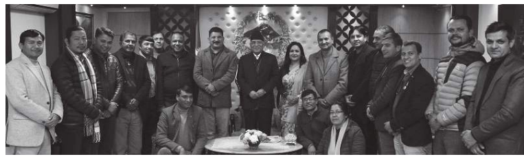
प्रधानमन्त्री दाहालले मुलुकका लागि केही नयाँ गर्ने सङ्घसहित प्रधानमन्त्रीको जिम्मेवारी लिएको उल्लेख गर्दै आफ्नो कार्यकालमा कुनै पनि नराप्ति काम हुन नदिन सचेत रहेको बताए ।

काठमाडौं/मस- प्रधानमन्त्री पुष्पकमल दाहाल 'प्रचण्ड'ले वर्तमान सरकार प्रेस स्वतन्त्रता र पत्रकारको हितप्रति संवेदनशील रहेको बताएका छन् । प्रधानमन्त्रीको निवास बालुवाटारमा आज नेपाल पत्रकार महासंघको प्रतिनिधिमण्डलसंगको भेटमा उनले सरकार पत्रकार महासंघसँग सहकार्य गरेर अगाडि बढ्न तयार रहेको बताए ।