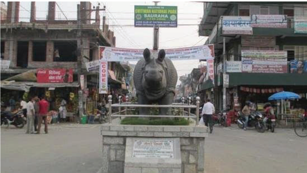
नारायण अर्याल/मध्याह्न काठमाडौं, ७ मंसिर

नेकपा (एमाले)को दशौं महाधिवेशनको अवधिमा सौराहाका सबै होटल बुकिङ भएका छन्। गराउन समस्या भएको संघका अध्यक्ष मांशिर १०, ११ र १२ गते हुने