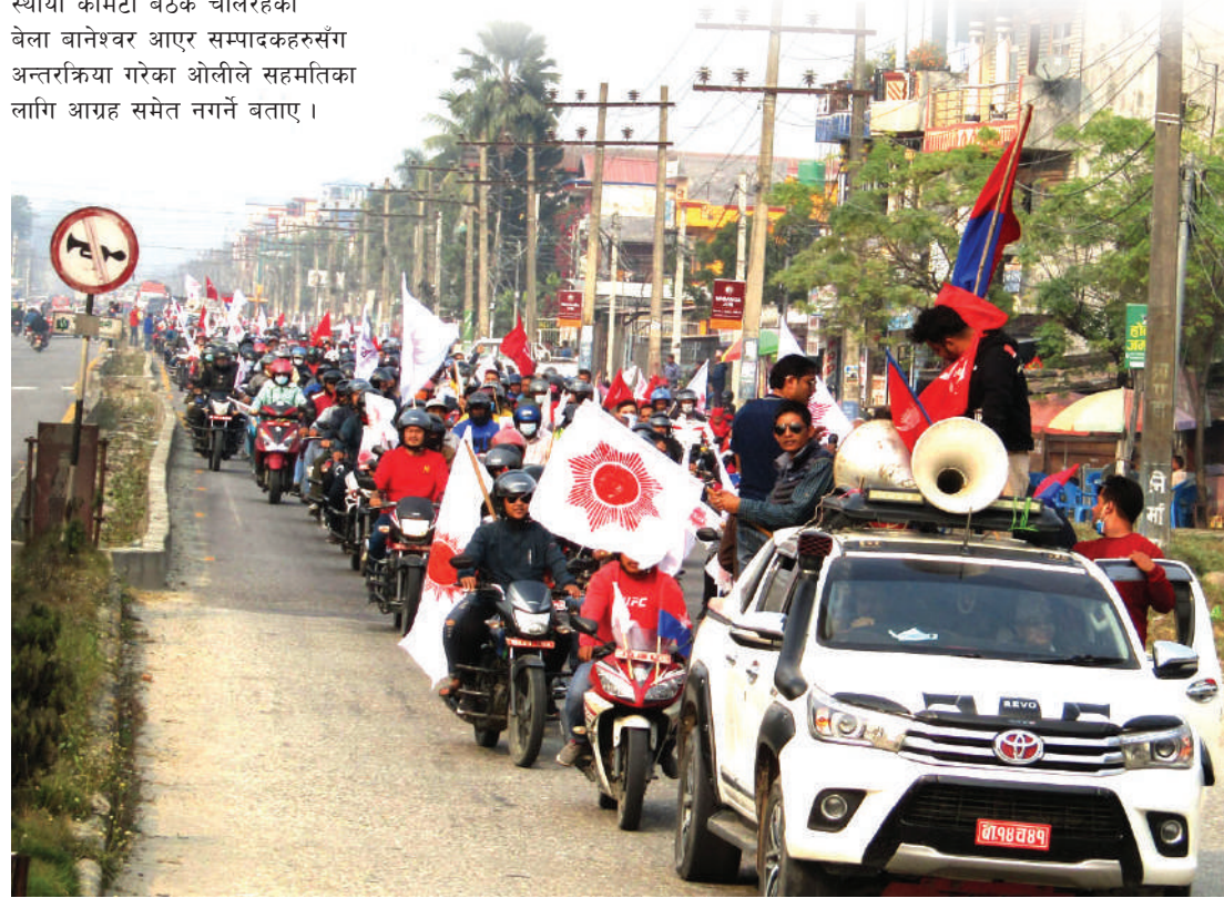
१०औं राष्ट्रिय महाधिवेशनको प्रचारप्रसारका लागि मंगलबार चितवनमा आयोजना गरिएको मोटरसाइकल चालीमा सहभागिहरु ।