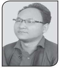
• निष्णु थिङ

नेपालका हरेक जनगणनाले हिन्दु धर्म मान्नेहरुको संख्या अत्यधिक देखाउँदै आएको छ । ८० प्रतिशतभन्दा बढी जनसंख्याले हिन्दु धर्म मानेको तथ्यांकले बताउँछ ।