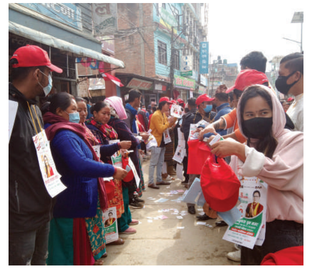
नेपाली काँग्रेसको क्षेत्रीय महाधिवेशन बागलुङ-१ को मतदान स्थलमा मत माग्दै उम्मेदवारहरु ।

मुक्ति रेग्मी / मध्यान्ह काठमाडौं, ७ मंसिर ।