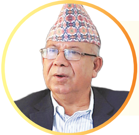
शिवराज परियार / मध्याह्न काठमाडौं, १६ पुस ।

एकातिर समाजवादी केन्द्र बनाऔं भन्ने माओवादी केन्द्र, जसपा र नेसपाको प्रस्ताव छ अर्को तिर एमालेले वाम एकताको प्रयासलाई अगाडि बढाउन चाहेको छ । यो बेला एकीकृत समाजवादी कुन धारलाई समात्ने भन्नेमा प्रष्ट छैन ।