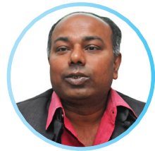
अस्मिता बस्म / मध्याह्न काठमाडौं, १६ पुस ।

प्रधानमन्त्री प्रचण्डलाई समर्थन दिएपनि सरकारमा सहभागी नभएको जसपाले अन्ततः सरकारमा जाने निर्णय लिएको छ । र मन्त्री छान्ने जिम्मा राजनीतिक समितिलाई दिइएको छ ।