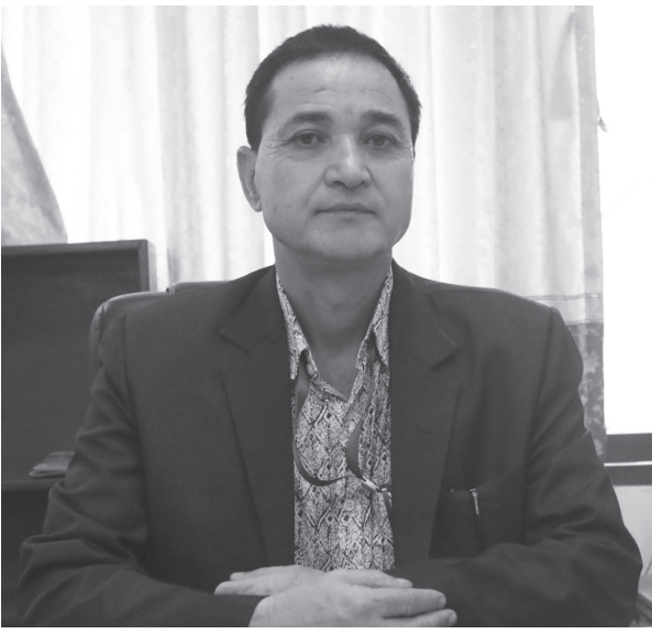
मध्याह्न संवाददाता काठमाडौं, २३ जेठ

युवा तथा खेलकुद मन्त्रालयको मन्त्रालयभन्तरगतकै खेलकुद विकास महाशाखाका प्रमुख भक्तवहादुर