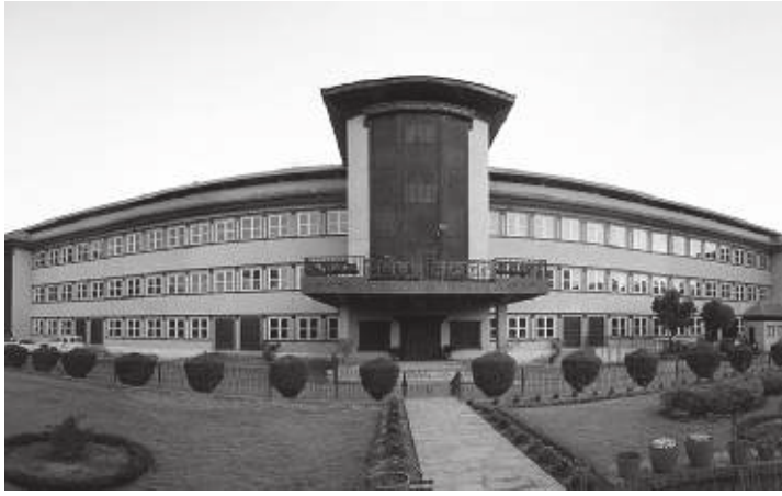
मापदण्ड नेपाल सरकार मन्त्रपरिषद्को मापदण्डलाई संशोधन गर्नेगरी निर्णय बैठकको गत जेठ ६ गतेको निर्णयले उल्लेखको आदेश बढाएर पाउँ ।'

'दुङ्गा, गिटी, बालुवा उत्खनन विक्री तथा व्यवस्थापन मापदण्ड २०७७ को दफा ४ (१०) मा साविकमा भएको घनावस्ती र वन क्षेत्रको दुई किलोमिटर राजमार्गको ५०० मिटर दूरीभित्र नदी भन्ने बाक्यांश हटाइएको छ', रिट निवेदनमा भनिएको छ, 'सो ऐनको दफा ११ (१) मा भएको