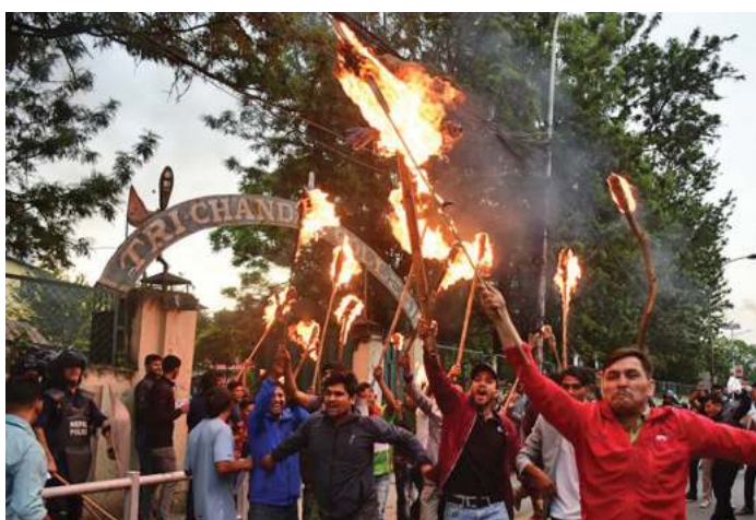
मूल्यबृद्धि फिर्ता लिन अनेरासवपिचुले सोमबार मूकुटीगण्डपका निकालेको प्रदर्शन ।

'यति ठूलो महंगी सायद इतिहासमा पहिलो पटक भएको छ । जनताको ढाड सेकेर असुली गरेको पैसा कहाँ गएको छ ?' उनले प्रश्न गरिन्, 'माननीय मन्त्रीज्यूहरूको संलग्नता भएको छैन भने किन मौन बस्नुभएको छ, किन मुकदर्शक बन्नुभएको छ ?' जेठमा पेट्रोलियम