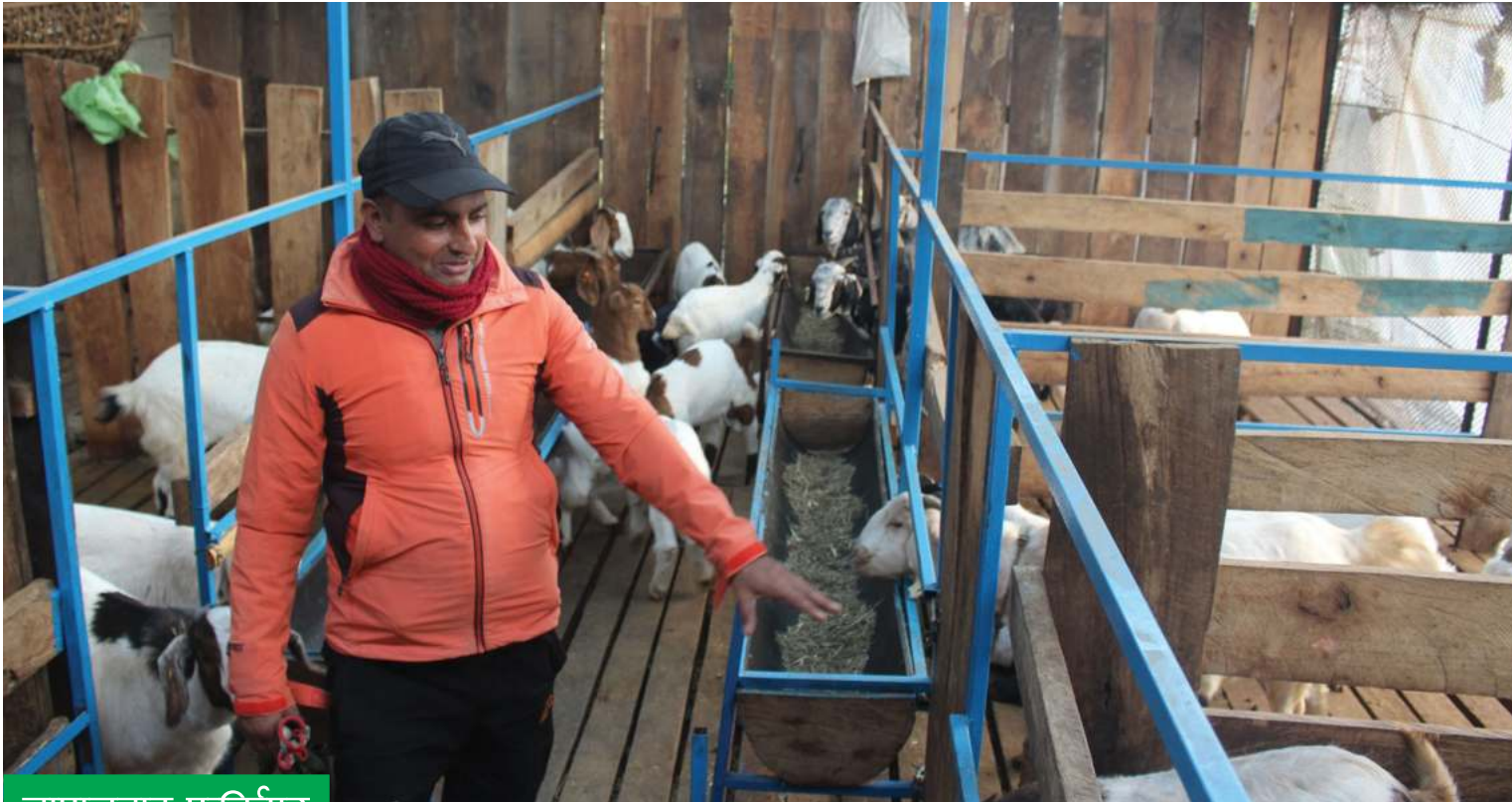
जापानबाट फर्किँएर बाखापालन

जापानमा दश वर्ष काम गरेर फर्किँएपछि ब्यावसायिक बाखापालनमा ज्याउदीको मङ्गला गाउँपालिका-२ का कृषा पौडेल