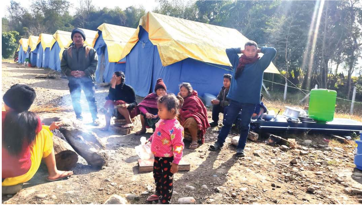
नवलपुरको हुस्केकोटमा पहिरो पीडितका लागि बनाइएका टेन्ट। विसौ बढेकाले टेन्टको बसाई काटिन बलेको छ।