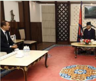
प्रधानमन्त्री शेरबहादुर देउवासँग बुधवार बहुदलीय प्राविधिक तथा आर्थिक सहयोगका लागि बंगाल सार्थीको प्रजास (बिस्केक) का महापिप तेविजि लेकपेले।

प्रधानमन्त्री शेरबहादुर देउवा आइतबार भारत भ्रमणमा निस्कने भएका छन्। प्रधानमन्त्री नियुक्त भएको ६ महिनापछि देउवा भारत भ्रमणमा निस्कन लागेका देउवाले समकक्षी नरेन्द्र मोदीसँग भेट हुने कार्यसूची छ।