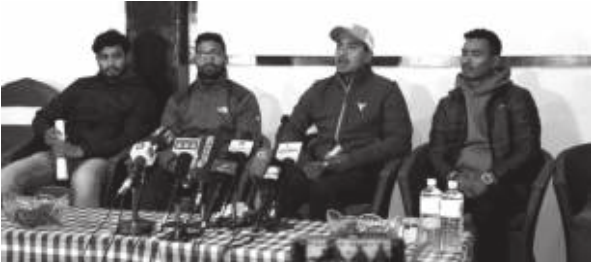
मध्यम संवाददाता काठमाडौं, २ पुस

नेपाली राष्ट्रिय क्रिकेटमा देखिएको पाछिल्लो विवाद समाधानका लागि कारवाहीमा परेकै चार खेलाडीले अप्रह्न गरेका छन्।