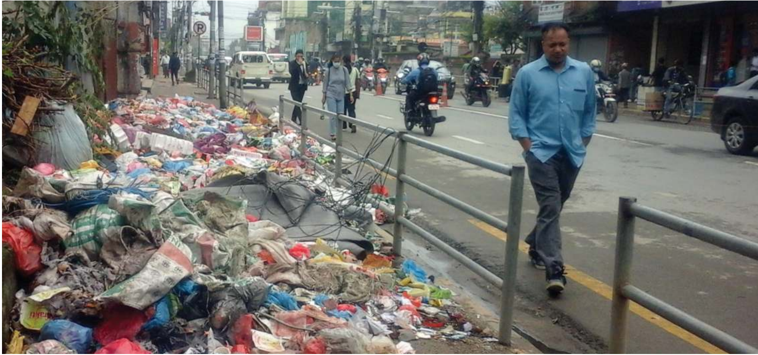
फोहरमय काठमाडौं । हतौदेखि फोहर जउदा राजधानी फेरि दुर्गन्धित हुन थालेको छ ।