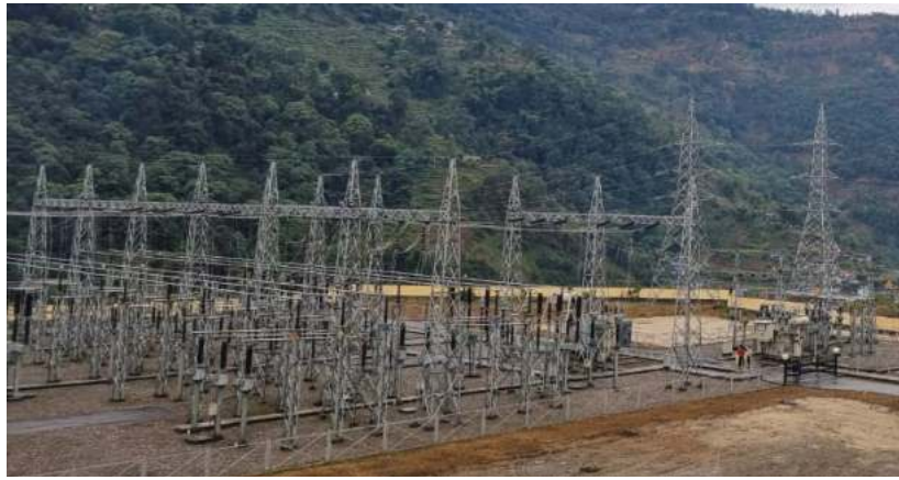
रमेश लम्साल/रासस काठमाडौं, ३ चैत

जलविद्युत् आयोजना निर्माण गरेर मात्रै हुँदैन । त्यसका लागि प्रसारण लाइन सबस्टेशनको पनि उचित आवश्यकता पर्दछ । प्रसारण प्रणालीको निर्माणपछि मात्रै जलविद्युत् आयोजनाबाट उत्पादित विजुली सबस्टेशन भएर तपाईं हाम्रो घर-घरमा आइपुग्छ । उद्योग कलकारखानामा पुग्छ । पछिल्ला दिनमा सरकारले जलविद्युत् आयोजनाको निर्माणसँगै प्रसारण प्रणाली र सबस्टेशन निर्माणमा पनि उचित ध्यान दिएको छ । देशभित्र उत्पादित विजुली देशभित्रै खपत गराउने उद्देश्यका साथ सरकारले अनेकन प्रयास गरिरहेको छ ।