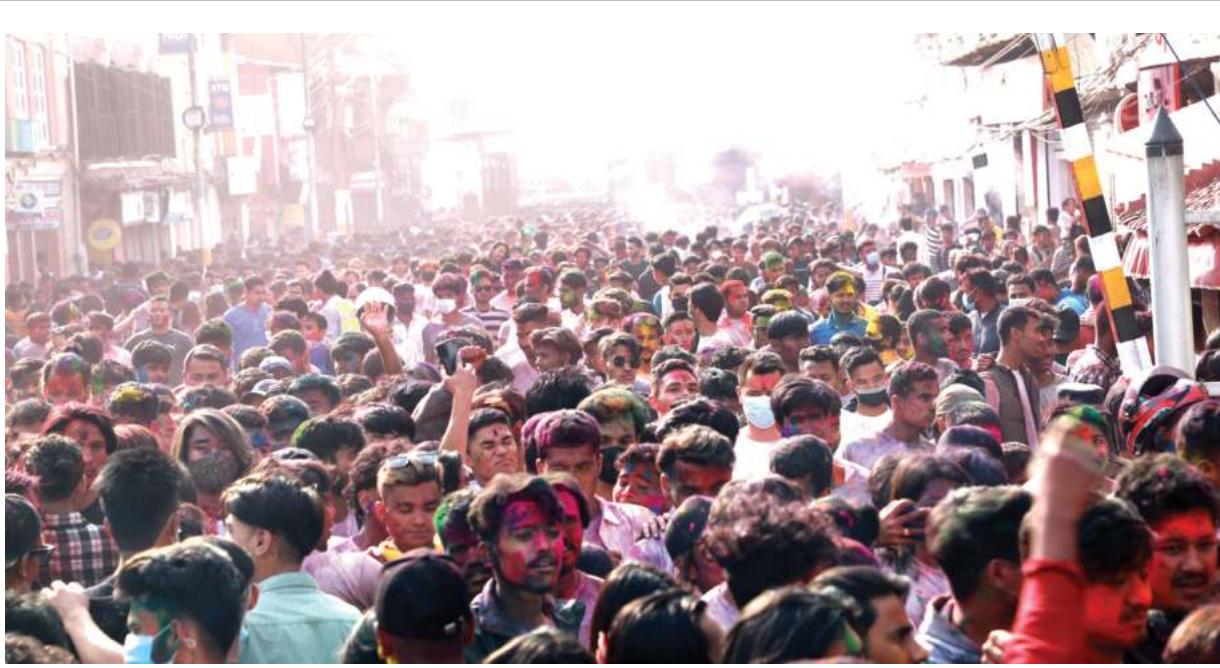
फर्किदिएको सुशी: कोरोना महामारीका कारण यसअघिका दुई वर्ष फागुन पूर्णिमा प्रतिबन्धात्मक व्यवस्थासहित मनाइएको थियो । तर यसपटक भने खुलेर रंगारुको पर्व होली मनाइएको छ । देशभरि जस्तै राजधानी काठमाडौंको वसन्तपुरमा होली मनाएको भीड लाग्यो ।

माधव नेपाललाई हराइदिने साना पार्टीहरूलाई हराउने नीति - बाँकी पृष्ठ २ मा