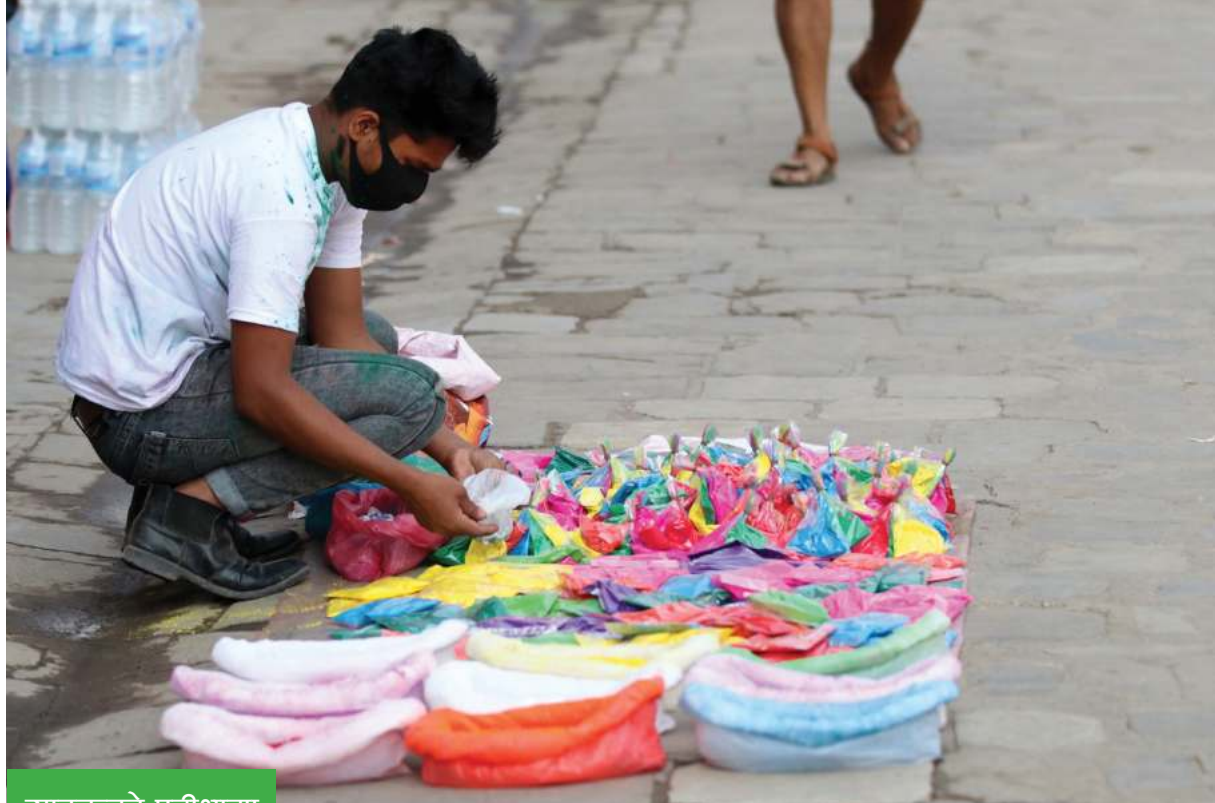
ग्राहकको प्रतीक्षामा रंग व्यापारी

काठमाडौंको न्यूरोडमा होली सेल्वेको रंग बेच्न ग्राहकको प्रतीक्षामा बसेका व्यापारी ।