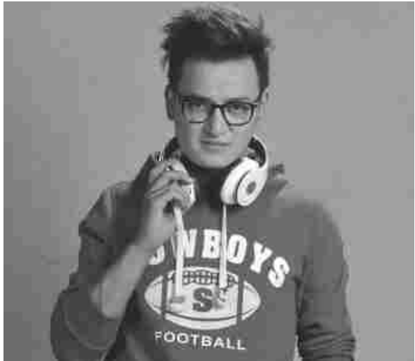
हजुर' सिरिजमा हिरोको साथीको भूमिकामा देखिँदा भने उनले अत्यधिक तारिफ पाउन सफल भए।

मध्याह्न संवाददाता काठमाडौं, ८ माघ सलोन बस्नेतले पुनः 'ए मेरो हजुर'को टिमसँग जोडिने भएका छन्।