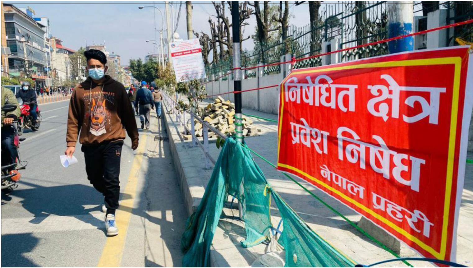
डोरी टाँगेर नागरिकलाई हिँडुल गर्न रोकिएको नयाँ बानेश्वरस्थित संसद भवन परिसरसँगैको फुटपाथ ।