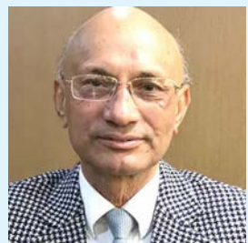
छवि सापकोटा/मध्यान्ह काठमाडौं, १५ फागुन।

तत्कालीन सेन्चुरी बैंकका दुई सिईओसहित १० जना पक्राउ