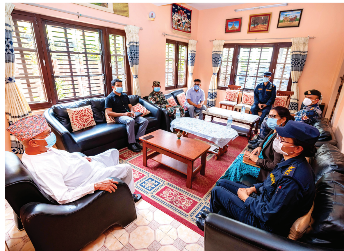
बालकोटमा प्रधानमन्त्रीः गएको फागुनमा दोस्रो पटक मितिगोला प्रत्यारोपण गराएपछि पहिलो पटक प्रधानमन्त्री केपी शर्मा ओली बालकोटस्थित आफ्नो निवासमा बालकोट पुगेका थिए । निवासमै आइपुगेका प्रधानमन्त्रीसँग भक्तपुरका सुरक्षा निकायका प्रमुख तथा प्रतिनिधिहरु ।

यस्तै फ्लाई दुबई, सलाम एयर, इण्डिगोले सातामा सात/सात वटा, टर्कीले छ वटा, जजीराले दुई वटा, एयर चाइना र चाइना साउथवर्नले सातामा एक/एक वटा मात्रै उडान अनुमति मागेका छन् । निगमले पाँच गन्तव्यमा उडान गर्दै राष्ट्रिय ध्वजावाहक नेपाल वायुसेवा निगम (नेपाल एयरलाइन्स) ले भदौ १ गतेबाट शुरु हुने अन्तर्राष्ट्रिय उडानका