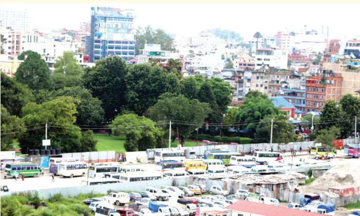
रत्नपार्क नजिक बसपार्कमा पार्किङ गरिएका सवारी साधन ।

लकडाउन खुलेपछि लगातार संक्रमित संख्या बढिरहेका बेला सोमबार एकै दिन ४१८ जनामा संक्रमण पुष्टि भएको छ ।