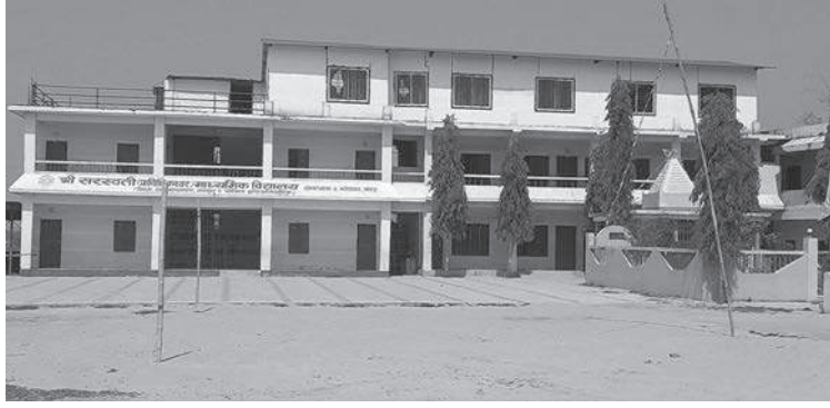
मध्याह्न संवाददाता काठमाडौं, २३ चैत

हाल सञ्चालन भइरहेको एसईई परीक्षामा एकै दिन ठूलो संख्यामा नक्कली परीक्षार्थी पक्राउ परेका छन्। मोरङमा एकैदिन १ सय ९९ जना नक्कली परीक्षार्थी फेला परेका हुन्। जिल्लाको ग्रामथान गाउँपालिका २ भोराहाटको श्री सरस्वती नमुना माध्यामिक विद्यालय परीक्षा केन्द्रपछि थप दुई विद्यालयबाट पनि एसईई दिइरहेका नक्कली परीक्षार्थी पक्राउ