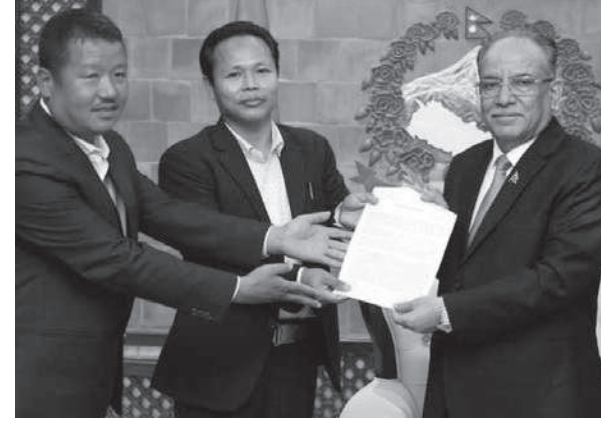
क्रममा निधन भएकाको परिवारलाई क्षतिपूर्तिको व्यवस्था गर्न पनि उनीहरूले माग गरेका छन्। यसअघि माओवादी केन्द्रले कोशी प्रदेशको नाम पहिचानमा आधारमा राखिनुपर्ने अडान रहेको

(माओवादी केन्द्र) निकट जनवर्गीय संगठनहरूले पहिचानको आधारमा कोशी प्रदेशको नामकरण गर्न माग गर्दै प्रधानमन्त्री पुष्पकमल दाहाल 'प्रचण्ड'लाई जापनपत्र बुझाएका छन्। किराती राष्ट्रिय मुक्ति मोर्चा, लिम्बूवान राष्ट्रिय मुक्ति मोर्चा, लिम्बूवान राष्ट्रिय संगठनका पदाधिकारीसहितको प्रतिनिधिमण्डलले बालुवाटार पुगेर प्रधानमन्त्री 'प्रचण्ड'लाई जापनपत्र बुझाएका हुन्। प्रदेशको नाम कोशी भएपछि उत्पन्न परिस्थितको तत्काल वार्ताबाट हल गर्न र आन्दोलनको