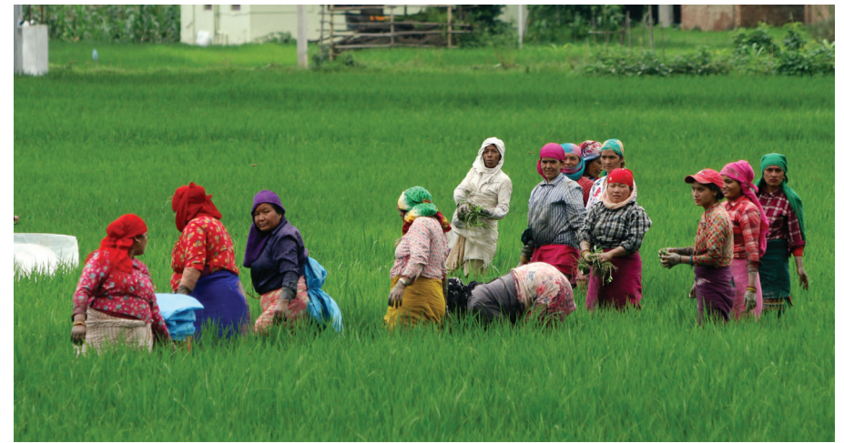
भक्तपुरको सुर्यविनायक नगरपालिकाअन्तर्गत चित्रपुरमा किसान धान गोड्दै। रोपाईं सकेपछि धान नकाटेसम्म तीन पटक किसानले धान गोड्ने गर्दछन्।

तीन सय स्थानीय तहमा सञ्चालनमा ल्याउने तयारी भएको भूमि बैंक असोजदेखि कार्यान्वयनमा ल्याउने तयारी गरेको छ।