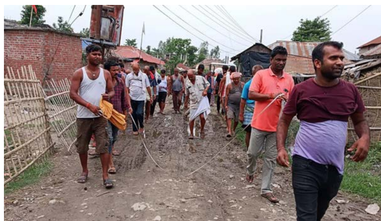
पिन्टु यादव/मध्यान्ह सप्तरी, १९ जेठ।

सप्तरीको जण्डौल-कुशाहा सडकको योजना पास भएको एक दशक बित्यो। तर, यो सडकले पूर्णता पाउन सकेको छैन। पछिल्लो एक दशकदेखि सप्तरीको जण्डौल-कुशाहा सडकका लागि प्रत्येक वर्ष बजेट पर्छ। तर, अदालतमा परेको मुद्दा फैसला नहुँदा बजेट खर्च नै हुँदैन। यो समस्याको मार स्थानीयले खेपिरहेका छन्। सडकदेखि कुशाहासम्म ग्रामीण