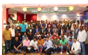
तिलु शर्मा/पौडेल/मध्यान्ह दोहा, कतार, १९ जेठ

कतारस्थित नेपाली दूतावासले श्रमिक सुरक्षा तथा जनचेतनासम्बन्धी अभिमुखीकरण कार्यक्रम सम्पन्न गरेको छ। दूतावासको आयोजना तथा गैरआवासीय नेपाली संघ राष्ट्रिय समन्वय परिषद् कतारको समन्वयमा सन्ध्यामा अवस्थित फुलवारी रेस्टुरेन्टको सभा हलमा पहिलोपटक आयोजना गरिएको कार्यक्रममा श्रमिकहरूको बाक्लो उपस्थिति रहेको थियो। सार्वजनिक कार्यक्रममा पहिलो पटक सहभागिता जनाएका श्रमिकहरूको पनि उक्त कार्यक्रममा >>> पृष्ठ २ मा