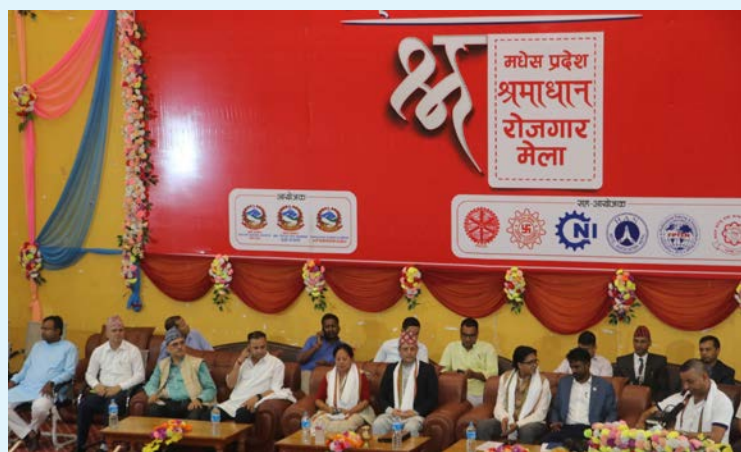
जनकपुरधाम, १९ जेठ

श्रम, रोजगार तथा सामाजिक सुरक्षामन्त्री डोलपसाद अर्यालले मधेशबाट टूलो संख्यामा युवाहरू वैदेशिक रोजगारीमा जाने बाध्यता अन्त्य गर्नका लागि स्थानीयलाई रोजगारी दिन उद्योग व्यवसायीहरूसँग आग्रह गरेका छन्। मधेशको प्रादेशिक राजधानी जनकपुरधाममा शनिवार आयोजित श्रममन्त्रीको आग्रह मेलाको उद्घाटन गर्दै मन्त्री अर्यालले