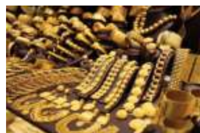
प्रतितोला रु ९४ हजार १०० थियो।

नेपाल सुनचाँदी व्यवसायी महासङ्घले सार्वजनिक गरेको तथ्याङ्कानुसार तेजावी सुनको आजको मूल्य प्रतितोला रु ९३ हजार ८०० तोकिएको छ जसको मूल्य आइतबार