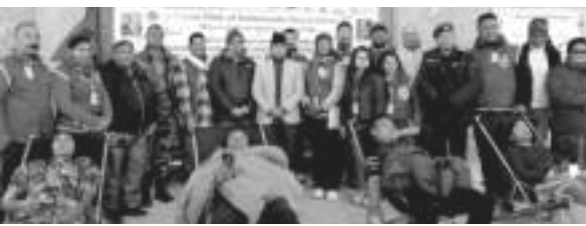
काठमाडौँ/सस-लायन्स क्लब अफ काठमाण्डू ब्लड सर्कलले सोलुखुम्बुको सल्लेरीस्थित थोड स्टार क्लबसंगको सहकार्यमा दुई हजार तीन सय पचास मिटर उच्च ठाउँमा ७१ जनाले रक्तदान गरेर विश्व कीर्तिमान बनाएको छ ।

जोशीले दुर्गम ठाउँको रक्तदान कार्यक्रमले राग सम्बन्धिको महत्त्व र आवश्यकता विषयमा सकारात्मक संन्देश प्रवाह हुने विश्वास व्यक्त गरे ।