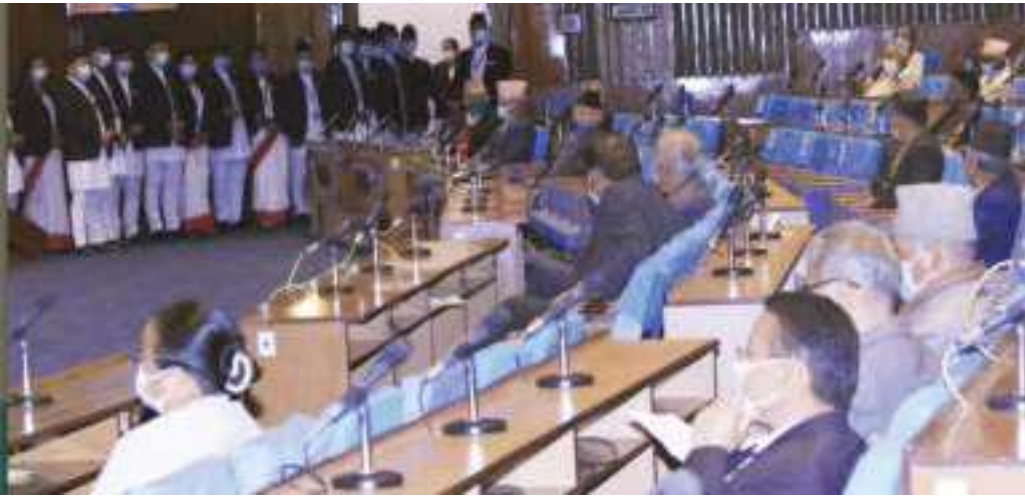
दिवाकर अधिकारी / मध्याह्न काठमाडौं, २२ फागुन ।

अर्लि इलेक्सनमा जान सक्ने विकल्पमा सत्तारूढ दलकै नेताहरुको आपत्ति छ । उनीहरु भन्छन्, 'दुई कारणले अब अर्लि इलेक्सनको संभावना र बहस अप्रासंगिक भएको छ- संसदीय प्रक्रियामा एमालेको सहभागिता र सर्वोच्च अदालतको आदेश ।'