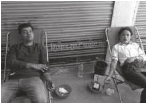
देवराज सुवेदी/मध्यान्ह सिन्धुपाल्चोक, २२ फागुन

मेलम्चीमा आयोजना गरिएको रक्तदान कार्यक्रममा ७९ जनाले रक्तदान गरेका छन्। सिन्धु विकास वैक मेलम्ची शाखाको आयोजनामा आइतबार भएको कार्यक्रममा सर्वसाधारण, प्रहरी, कर्मचारी, व्यवसायी लगायत ७९ जनाले रक्तदान गरेका हुन्। नेपाल रेडक्रस सोसाइटी सिन्धुपाल्चोक, भक्तपुर