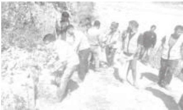
बाजुरा, २४ असोज