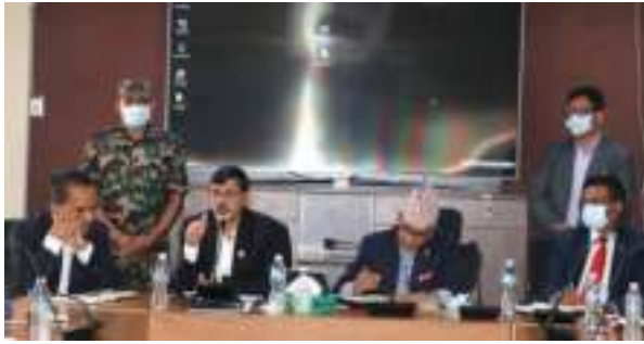
सागर तिमल्सिना/मध्यान्ह काठमाडौं, २४ असोज ।

सरकारले पूँजीगत खर्च बढाउन ठेक्का सम्बन्धी कागजातमा विर्से र राती गरी दुई सिफ्टमा काम गर्नुपर्ने व्यवस्था लागू गर्न लागेको छ । आइतबार अर्थमन्त्रालयले राष्ट्रिय योजना आयोगका पदाधिकारीहरूसँग छलफल गर्दै यस्तो संकेत गरेको हो ।