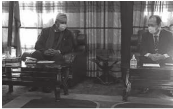
काठमाडौं/मस- स्वास्थ्य तथा जनसंख्यामन्त्री विरोध खतिवडा र नेपालका लागि जापानका राजदूत किकुता युताकाबीच भेटघाट भएको छ।

मन्त्रालयमा विहीवार आयोजित भेटमा दुई देशबीच परस्परिक सहयोग र कोभिड-१९ को रोकथाम तथा नियन्त्रणका लागि निर्वाह गर्नसक्ने भूमिकाबारे छलफल भएको थियो।