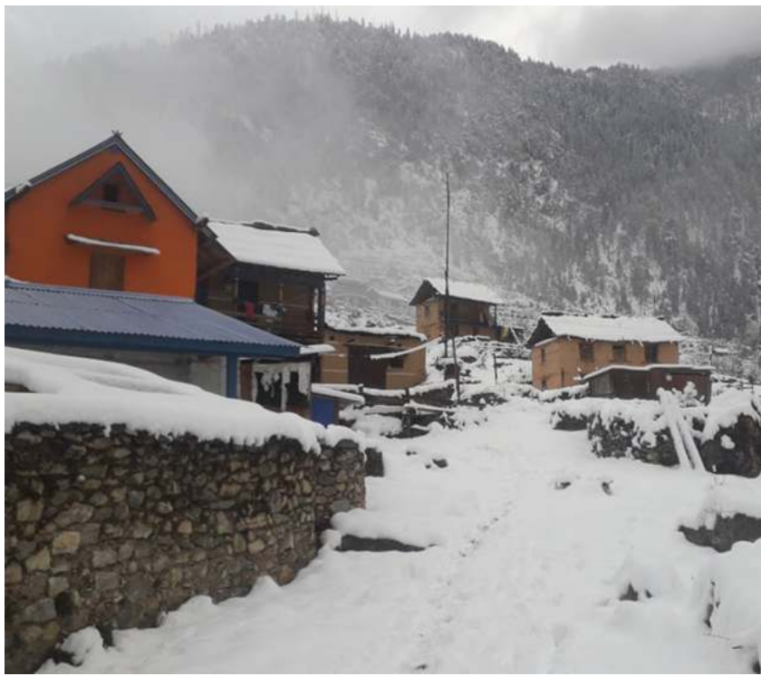
तल्लो डोल्पाको मुडुकेचेला गाउँपालिकाको प्रशासकीय केन्द्र नकुर्मा गाउँ हिमपात । हिउँ परेकाले अन्नबाली राम्रो उत्पादन हुने किसान बताउँछन् ।

काठमाडौं उपत्यकाका डाँडासहित देशका धेरै उच्च पहाडी र हिमाली जिल्लामा हिमपात भएपछि जनजीवन कष्टकर बनेको छ ।