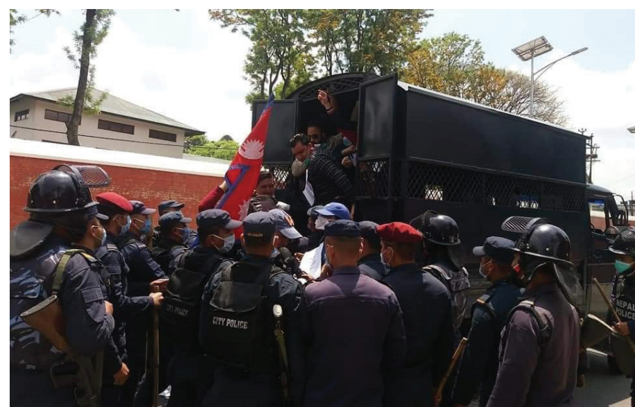
प्रदर्शनमा उत्रिएका विद्यार्थीहरूलाई पक्राउ गर्दै प्रहरी

उनले लेखेका छन्, “नेपाली भूमि अतिक्रमण गरी बाटो बनाउने भारतीय मिचाहा प्रवृत्ति विरुद्ध सरकारको बक्तव्य सही छ। सो भावना अनुरूप भारत सरकारलाई विरोधपत्र पठाउन, भारतीय राजदूतलाई बोलाई विरोध जनाउन र राष्ट्रिय सहमति कायम गरी राष्ट्रसंघमा आवाज उठाउने लगायत अन्य कदम चाल्न सरकारसँग आग्रह गर्दछु।”