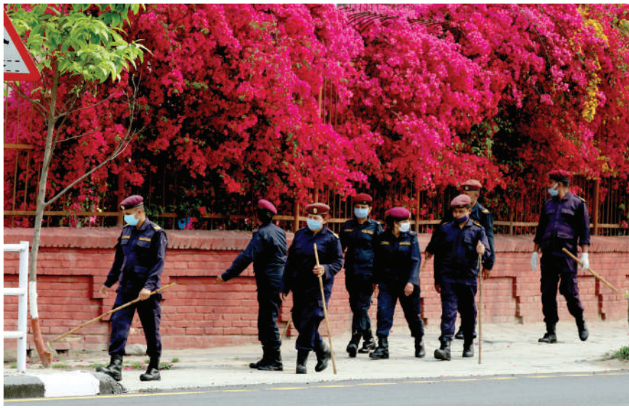
लक डाउनको अवधिमा सर्वोच्च अदालतअगाडि सडकमा आइतबार डिउटीमा खटिएका सुरक्षाकर्मी । सर्वोच्च परिसरमा ढकमक्क फुलेको फूल ।

विश्व बैकले कोरोना भाइरसको महामारीका कारण चालु आर्थिक वर्षमा नेपालको आर्थिक वृद्धिदर व्यापक घटने प्रक्षेपण गरेको छ । ६.४ प्रतिशत वृद्धिदर हासिल हुने अनुमान गरिएकोमा यसपटक व्यापक गिरावट आएर १.५ प्रतिशत देखि २.८ प्रतिशतको बीचमा रहने प्रक्षेपण गरिएको छ । जवकी, गत आर्थिक वर्षमा नेपालले ७.१ प्रतिशतको आर्थिक वृद्धिदर हासिल गरेको थियो । विश्व बैकले चालु आर्थिक वर्ष मात्रै नभएर आगामी आर्थिक वर्षको आर्थिक वृद्धिदर पनि १.४ देखि २.९ प्रतिशतको बीचमा रहने प्रक्षेपण गरेको छ ।