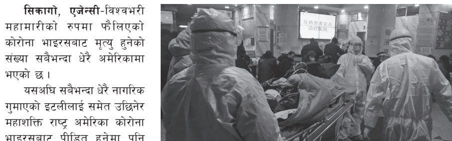
सिकागो, एजेन्सी-विश्वभरी महामारीको रूपमा फैलिएको कोरोना भाइरसबाट मृत्यु हुनेको संख्या सबैभन्दा धेरै अमेरिकामा भएको छ।

अप्रपङ्गीमा रहेर सङ्क्रमितको उपचार गर्ने चिकित्सक, स्वास्थ्यकर्मी तथा सरसफाईमा सम्लग्न रहने स्वास्थ्य संस्थाका कामदारले मास्क, चस्मा, पञ्जा तथा गाउनजस्ता व्यक्तिगत सुरक्षा सामग्रीको सही प्रयोग गरी संक्रमणबाट आफु र अरुलाई बचाउन प्रयाप्त सावधानी अपनाउनुपर्नेमा पनि विश्व स्वास्थ्य संगठनले जोड दिएको छ। स्वास्थ्यकर्मीबाट पनि संक्रमण फैलिएका बताउँदै संगठनले सही पद्धतिमार्फत काम गर्न उनीहरूलाई आग्रह गरेको छ।