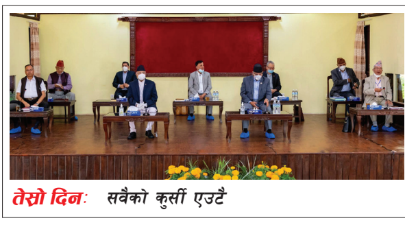
तेस्रो दिन: सबैको कुर्सी एउटै