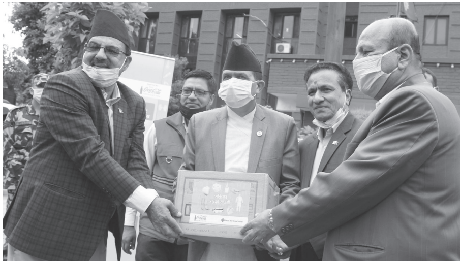
स्वास्थ्य तथा जनसंख्यामन्त्री भानुभक्त ढकाललाई मंगलबार मन्त्रालयमा स्वास्थ्य सामग्री हस्तान्तरण गर्दै नेपाल रेडक्रस सोसाइटीका पदाधिकारी ।

नेपालमा मंगलबारसम्म संक्रमितको संख्या १३ हजार ५ सय ६४ पुगेको छ भने डिस्चार्ज हुनेको संख्या ३ हजार १ सय ९४ पुगेको छ ।