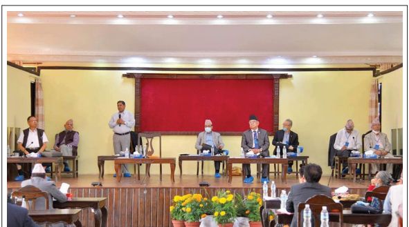
दोस्रो दिन: सोफा हटाइयो