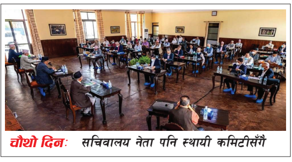
चौथो दिन: सचिवालय नेता पनि स्थायी कमिटीसँगै