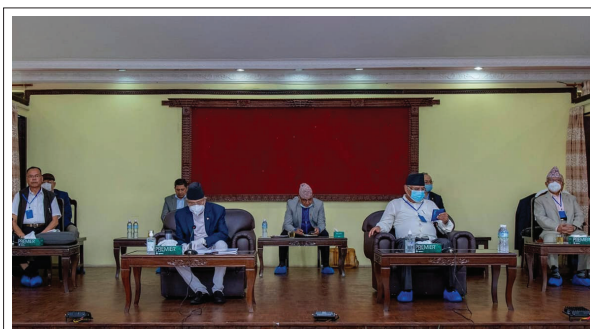
पहिलो दिन: दुई अध्यक्ष सोफामा

सत्तारूढ नेपाल कम्युनिष्ट पार्टी (नेकपा) को स्थायी कमिटी बैठकको एजेण्डा प्रभावित बनेको छ। मदन भण्डारी फाउण्डेसनको कार्यक्रममा प्रधानमन्त्रीले आफूलाई पदबाट हटाउन भारतीय दूतावास सक्रिय भएको भन्ने अभिव्यक्ति दिए पछि स्थायी कमिटीको एजेण्डा नै प्रभावित बनेको हो।