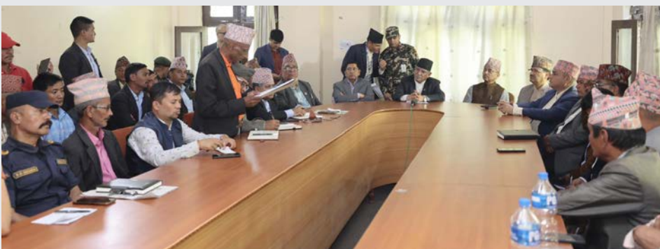
बाबाक वैद्यपुरिबाट टिकला प्रशासन कार्यालयमा प्रजातन्त्र, उपप्रधानमन्त्री, मन्त्रीहरूलाई शुक्रवार भएको अनुरोधकर्ताका कार्यकर्ता ।

राहत सामग्रीहरू पाल, कम्बल, औषधि, खाद्यान्न, लत्ताकपडा, अपाङ्गता भएका व्यक्तिलाई आवश्यक पर्ने सामग्रीहरूको व्यवस्थापन गरिनेछ भने थप सामग्री आवश्यक परेमा ती तहका सरकारको समन्वयमा व्यवस्था गरिनेछ।