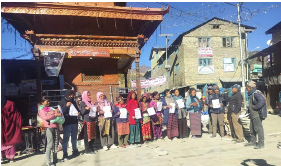
बजार आउजाउ गर्न दैनिक ६ सय रूपैयाँ लाग्ने गरेकाले तीन सय लिनका लागि बजार आउन नसकिने बताए।

जुम्लाको दियालो बहुउद्देश्यीय सहकारी संस्था जुम्लामा बचत गर्ने बचतकर्ता यतिबेला सडकमा आएका छन्। सहकारीले बचत गरेको रकम फिर्ता लिन समस्या देखिएपछि बचतकर्ताहरू सडकमा आएका हुन्।