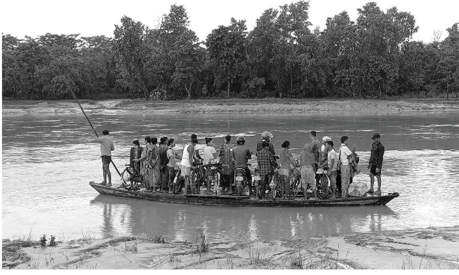
कैलालीको ठाजनी नगरपालिकामा पर्ने कावडा नदी डुङ्गामार्फत वारपार गर्दै स्थानीय बासिन्दा । हुलाकी राजमार्गमा निर्माण हुन लागेको पुनः दस वर्षसम्म पनि निर्माण सम्पन्न नभएको वर्षातको समयमा स्थानीय बासिन्दा ज्यानको जोखिम मोलेरै डुङ्गाबाट नदी वारपार गर्दै आएका छन् ।