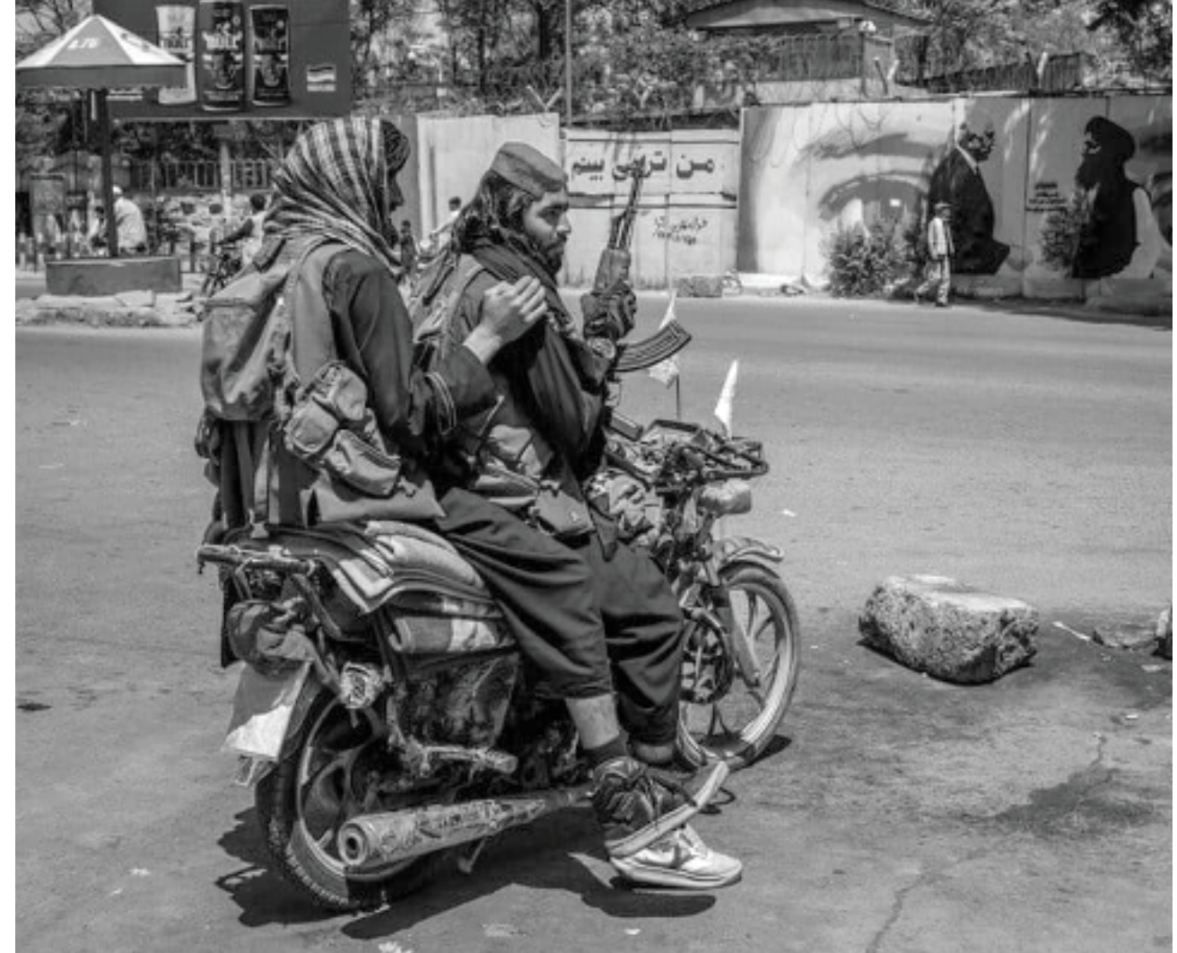
मिलीले बताएका छन्। गएको विहीवार आइएस-के ले गरेको आक्रमणमा १३ अमेरिकी सैनिकसहित कम्तीमा १७० जनाको ज्यान गएको थियो।

काठमाडौं/एजेन्सी- अमेरिकाका शीर्ष सैनिक जनरलले तालिबान 'निर्दयी समूह' रहेको बताउँदै उनीहरूमा परिवर्तन आएको वा आउने छ भन्ने स्पष्ट नरहेको उल्लेख गरेका छन्। सैनिक जनरल मार्की मिलीले तर भविष्यमा प्रतिआतंकवादी अभियानमा इस्लामिक विद्रोही समूहसँग सहकार्यको सम्भावना भने रहेको बताएका छन्। अमेरिकी सैनिकको अन्तिम समूह मंगलवार अफगानिस्तानबाट फिर्ता भएको थियो। योसँगै अफगानिस्तानमा अमेरिकाको २० वर्ष लामो सैन्य अभियान समाप्त भएको थियो। अहिले तालिबानको नियन्त्रणमा रहेको अफगानिस्तानलाई लिएर आशंका, डर र बासको अवस्था छ। तालिबानले चाँडै नै नयाँ सरकारको घोषणा गर्ने तयारी गरेको छ। अमेरिकी सैनिकको फिर्ता प्रक्रिया जारी रहेका बेला तालिबानले अगस्ट १५ मा काबुल नियन्त्रणमा लिएको थियो। अमेरिकी सैनिकको अन्तिम समूह फिर्ता भएपछिको पहिलो सार्वजनिक टिप्पणी जनरल मिलीले रक्षा मन्त्री लोइड अस्टिनको उपस्थितिमा दिएका हुन्। सैनिक फिर्ताको क्रममा देखिएको अस्तव्यस्ततालाई लिएर अमेरिकी राष्ट्रपति जो बाइडेनको तीव्र आलोचना हुँदै आएको छ। अमेरिकाले लगानी तथा तालिबान दिएका अफगान सुरक्षा बल अप्रत्याशित रूपमा 'कोल्याप्स' हुँदा तालिबानले सहज रूपमा अफगानिस्तानमा नियन्त्रण कायम गरेको हो। बुधवार भएको पत्रकार सम्मेलनमा सैनिक जनरल मिली र रक्षा मन्त्री अस्टिनले सैनिकहरूले उद्धार अभियानका क्रममा गरेको कामको प्रशंसा गरे। यस्तै उनीहरूले अफगानिस्तानमा सेवा गरेका सैनिकहरूको पनि प्रशंसा गरेका छन्। अफगानिस्तानबाट जोखिममा रहेका व्यक्तिहरूको उद्धारका लागि तालिबानसँग सहकार्यको प्रयास भइरहेको मन्त्री अस्टिनले बताएका छन्। भविष्यमा इस्लामिक स्टेट-के विरुद्धको अभियानमा तालिबानसँग सहकार्य हुन सक्ने सैनिक जनरल