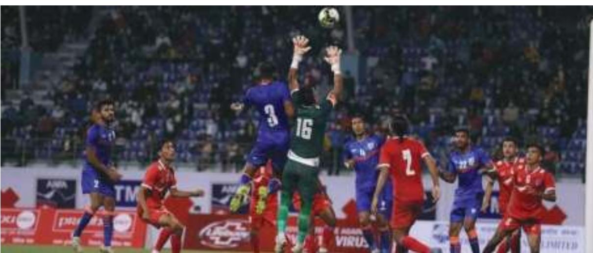
जाफा च्याम्पियनसिपको तयारीका क्रममा दशरथ रंजशालामा बिहीबार भएको तैत्रीपूर्ण खेलमा बलियो टीम भारतसँग एक-एक गोलको बराबरी खेलको छ ।

संवैधानिक परिषद् सम्बन्धी अध्यादेश र त्यसका आधारमा भएको नियुक्तका विरुद्ध परेको रिटमाथि प्रधानन्यायाधीश बिना हुने सुनुवाइ तत्काल रोक्न सर्वोच्च अदालतले अन्तरिम आदेश दिएको छ ।