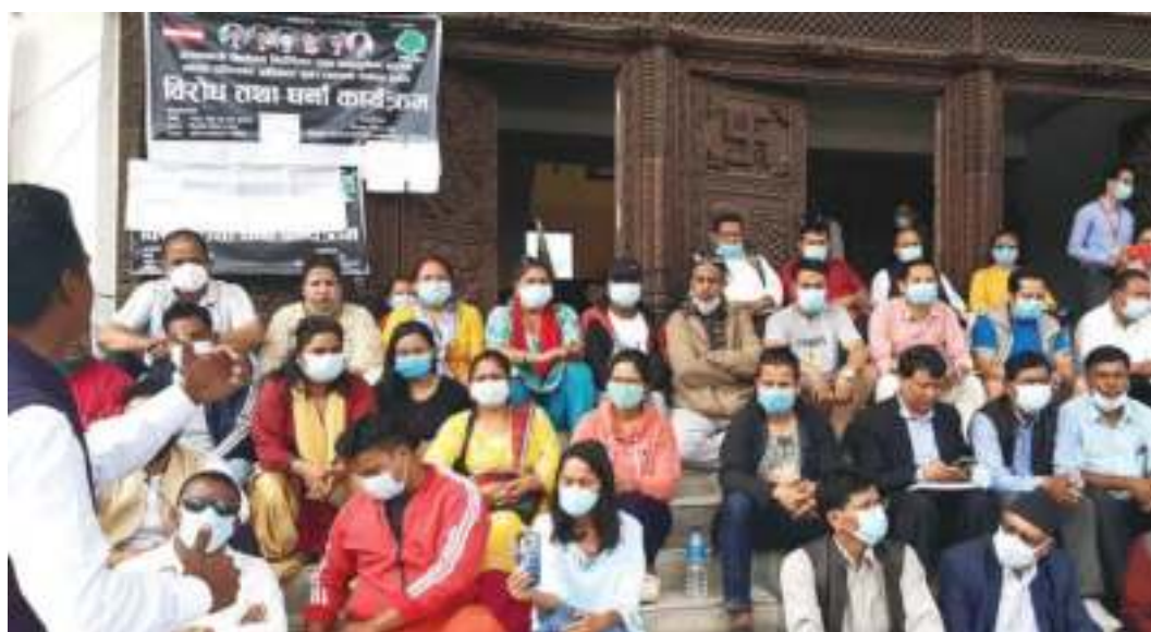
नेपाली काँग्रेसको वडा अधिवेशन शुरू हुनु एकदिन अगाडि विभिन्न ६ बुँदे माग सहित केन्द्रीय मुख्यालय साजेपामा धर्ना बसेका दलित समुदायका नेता धवका कार्यकर्ताहरू ।

सत्तारूढ दल नेपाली काँग्रेसको आगामी मंसिरमा हुने १४औं महाधिवेशन प्रक्रिया आजबाट शुरू हुँदैछ । आज ५६ जिल्लामा वडा अधिवेशन हुने काँग्रेसले कार्यतालिका तय गरेको छ ।