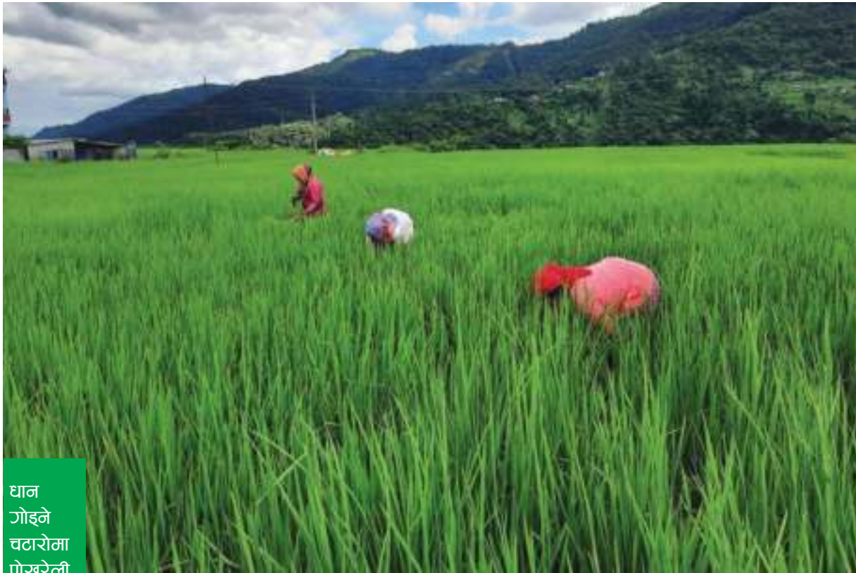
धान गोड्ने चढारोमा पोखरेली कृषक !

पोखरा-१७, तल्लो बिरौटा फाँटमा धान गोड्दै किसान ।