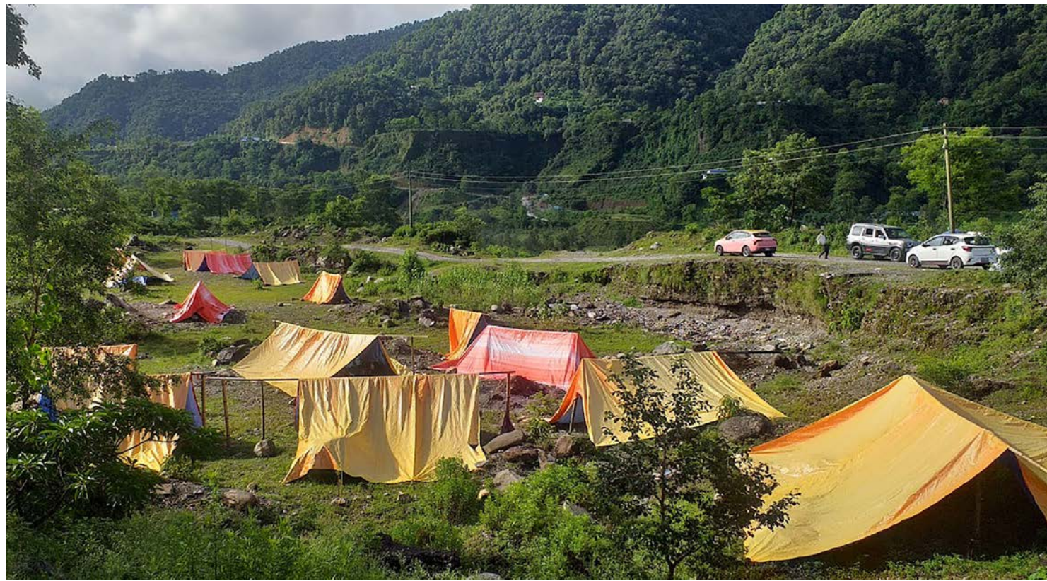
सेती नदीमा आएको बाढीले जात २२ असारमा घर बगाएपछि विस्थापित भएका ३२ घरपरिवार पोखरा-१५ स्थित जस्ती टोलमा त्रिपाल टाँगेर बसिरहेका छन् ।