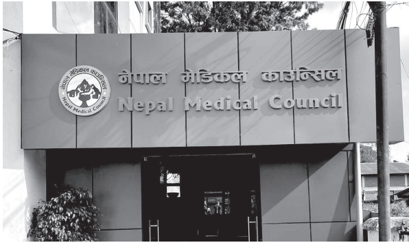
दिवस ढुक्काल, मध्याह्न काठमाडौं, ३ कात्तिक

नेपाल मेडिकल काउन्सिलको उपाध्यक्ष र सदस्य पदको लागि निर्वाचन कार्यतालिका सार्वजनिक गरिएको छ।