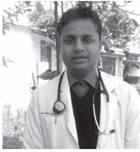
अहिले आमा र छोरीको स्वास्थ्य राम्रो भएको बताए।

सरकारी अस्पताल भन्नासाथ सेवा र सुविधाको विषयमा विभिन्न किसिमका टिप्पणी हुने गरेका छन्। कतिपय सरकारी अस्पतालमा बिरामीले भनेजस्तो उपचार नपाउने भएका कारण पनि सरकारी अस्पतालप्रति आममानिसको दृष्टिकोण नकारात्मक भएको पाइन्छ। सहज रूपमा उपचार नपाउने र चिकित्सकलाई पनि भेट्न मुस्किल पर्ने भएकाले बिरामीहरू निजी अस्पताल तथा क्लिनिकहरूमा घाउने गरेका छन्। तर पछिल्लो समय जिल्ला अस्पताल अर्घाखाँचीको हकमा भने यो अवस्था फेरिएको छ।