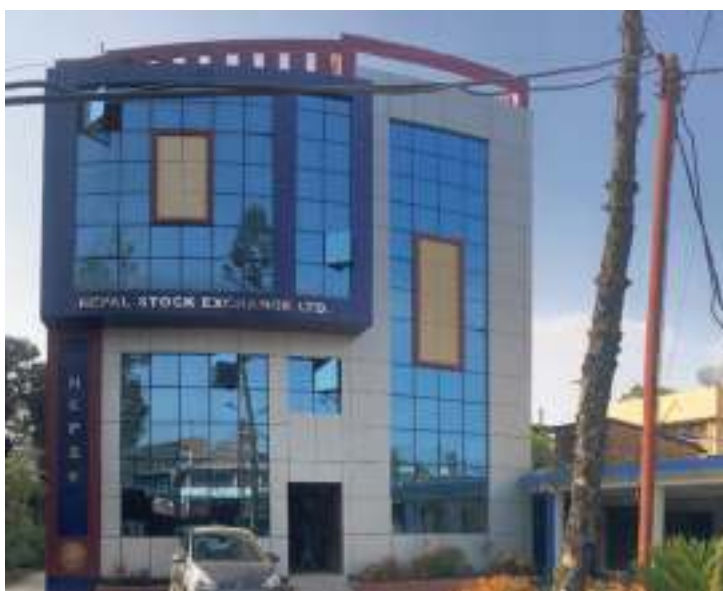
चिरन भट्टराई/मध्यान्ह काठमाडौं, ४ असोज ।

सोमवार शेयर बजारमा तीन अंकको गिरावट आएको छ। बजारमा पैनिक सेल आएपछि नेप्से सूचक १ सय १४.०२ अंकले घटेर २ हजार ६ सय ९८.२५ विन्दुमा फरेको छ। 'क' वर्गका कम्पनीहरूको कारोबार मापन गर्ने सेन्सेटिभ परिसूचक पनि १९.५१ अंकले घटेर ५ सय ६.२७ विन्दुमा फरेको छ।