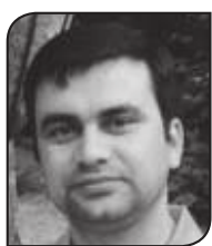
● नारायण गार्ँले

हामीले बनाउन नसकेपछि सहयोग मागिएको थियो । मान्ने बेला कसरी तीर्थयात्रीलाई होटलभन्दा धर्मशालाले सार्वजनिक र सहजतापूर्वक सुलभ बास दिन्छ भनेर मिठो निबन्ध नै लेखिएको थियो । होटलमा क्यासिनोदेखि माछा मासुसम्म पाउने हुनाले किन तीर्थयात्रीहरू सकेसम्म होटलमा बास बस्न रुचाउनुन् भनेर सानोतिनो अध्ययन-रिपोर्ट नै त्यसमा हुँदो हो । तर, दुर्भाग्य के भने हामीसँग धर्मशाला मात्र नभएको होइन, धर्मशालाको अर्थ र यसलाई चलाउने ज्ञान र योजना केही पनि रहेनछ ! जब यो बन्थो र हस्तान्तरण भयो, हामी आत्तियौं । यस्तो सफासुधर र शानदार संरचनामा 'नाथे' तीर्थयात्रीलाई मात्रै राख्ने कुरो भएन । धर्मशाला भनेर मागेको संरचनामा ताताते पार्टीको अफिस खोल्ने कुरो पनि भएन । समग्र पशुपति क्षेत्रको विकास र सम्बर्धन गर्न खोलिएको समितिसँग एउटा धर्मशाला बनाउने होइन, चलाउन सक्नेसम्म योजना र खुदी पनि रहेनछ । जबकी भारतका