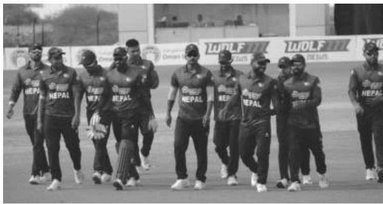
मध्यान्ह संवाददाता काठमाडौं, ५ फागुन

आइसिसी पुरुष टी-२० विश्वकप ग्लोबल छनोटअन्तर्गत समूह 'ए' को खेल शुरुवातदेखि ओमानमा शुरु हुँदै छ। ओमानको एकेडेमी १ मा हुने खेलमा नेपालले विजयी लक्ष्य हासिल गर्ने उद्देश्यका साथ शुरुवात ओमानको सामना गर्नेछ। विश्वकप ग्लोबल छनोटको तयारीस्वरूप नेपालले यसअघि चार देश सम्मिलित टि ट्वान्टी सिरिज खेलेको थियो। यसमा नेपालले ओमानलाई ६ विकेटले पराजित गरेको थियो।