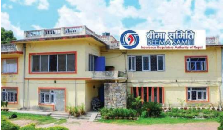
नारायण अर्वाल/मध्यान्ह काठमाडौं, ५ फागुन

मर्जरमा जान चाहने बीमा कम्पनीहरूले थप सुविधा तथा छुट पाउने भएका छन्। बीमा समितिले मर्जरमा जाने बीमा निर्देशिकांमार्फत थप छुट तथा सुविधाको व्यवस्था गरेको हो। बीमा समितिले कम्पनीहरूलाई जारी गरेको बीमक गाभ्ने, गाभ्ने तथा प्राप्त गर्ने सम्बन्धी निर्देशिका, २०७६ लाई प्रथम पटक संशोधन गर्दै थप सुविधा तथा छुट उपलब्ध गराउने निर्णय गरेको छ। बीमकलाई गाभ्ने कारणबाट गाभ्ने बीमकको सेयर संरचनामा कुनै व्यक्ति, समूह वा संस्थाको नाममा चुक्ता पुँजी पन्ध्र