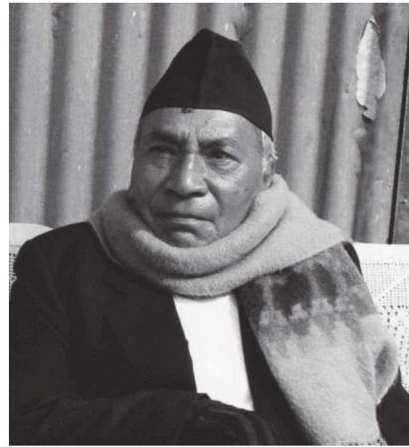
काठमाडौं/मस- प्रजातन्त्र पुनःस्थापनाका लागि विसं २०४६ मा भएको जनआन्दोलनका सर्वोच्च कमाण्डर गणेशमान सिंहको १०८औं जन्मजयन्ती विहीबार विभिन्न कार्यक्रम आयोजना गरी मनाइँदै छ।

नेपाली राजनीतिमा त्याग र साहसको उच्च उदाहरणका रूपमा रहेका सिंह सबैको निष्ठाको केन्द्र बन्न सफल भएको थियो। विसं २०४६ को जनआन्दोलन सफल भएपछि तत्कालीन राजा वीरेन्द्रले प्रधानमन्त्री बन्न गरेको आग्रहमा उनले आफ्ना समकक्षी नेता कृष्णप्रसाद भट्टराईलाई अघि सार्दै नेपाली राजनीतिमा त्यागको उच्च नमूना प्रस्तुत गरेका थिए। विसं १९७२ कात्तिक २४ गते काठमाडौंको क्षेत्रपाटीमा जन्मनुभएका नेता सिंहको विसं २०४४ असोज २ गते निधन भएको हो। काठमाडौंको खानदानी परिवारमा जन्मिएका सिंहले विसं १९९७ मा स्थापना भएको नेपालको पहिलो राजनीतिक पार्टी प्रजा परिषद्को सदस्य भएर राणा शासन हटाउने अभियानमा आफूलाई सक्रिय बनाएका थिए। राणा शासन अन्त्य गर्ने अभियानमा लागेपछि उनीलगायत नेतालाई तत्कालीन सरकारले जेल हाल्यो। विसं २००७ अघि नै