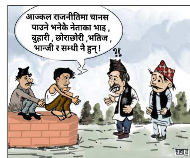
आजकल राजनीतिमा चानस पाउने भनेका नेताका भाइ, बुहारी, छोराछोरी, भतिज, भान्जी र सम्धी नै हुन् !

उनले परिवर्तन पीडादायी भए पनि सबै आवश्यक हुने बताए । 'परिवर्तन साँच्चै पीडादायी भए पनि सबै आवश्यक हुन्छ । >>> पृष्ठ २ मा