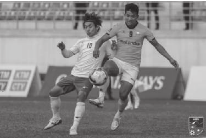
मध्याह्न संवाददाता काठमाडौं, १ फागुन

शहीद स्मारक ए डिभिजन लिग फुटबल अन्तर्गत आइतबार भएका खेलमा विभागीय टोली एपिएफ र संकटाले गोल रहित बराबरी खेल्दा पहिलो खेलमा न्युरोड टिम (एनआरटी) र हिमालयन शेर्पाले पनि बराबरी खेलेका छन् । त्रिपुरेश्वरस्थित दशरथ रंगशालामा भएको खेलमा आहा रारा गोलको उपाधि विजेता एपिएफले संकटासंग गोल रहित बराबरी खेलेको हो । निकै रोमाञ्चक र प्रतिस्पर्धात्मक बनेको खेलमा दुवै टोली तालिकामा सम्मान जनक स्थानको अपेक्षा सहित मैदान उत्रिएका थिए । तर पाएका केही राम्रा अवसरलाई दुवै टोलीले सदुपयोग गर्न नसक्दा अंक बाँड्न पुगे ।