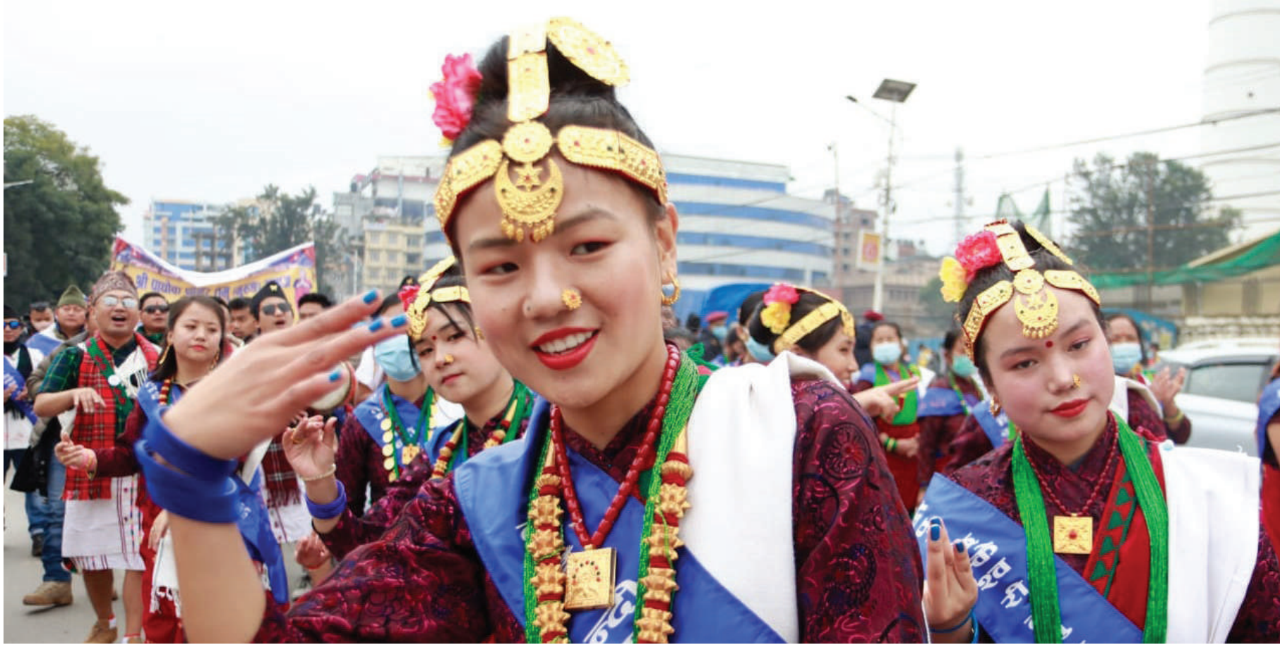
गुरुह समुदायको नयाँ वर्ष तमु ल्होसारमा भेषभुषासहित राजधानीमा निस्किएको प्रदर्शन।

ई-पत्रिका अनलाइन पढ्नका लागि क्यूआर कोड स्क्यान गर्नुहोला।