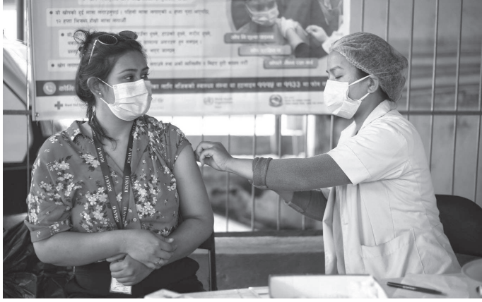
भने सबैलाई दिइनेछ।

सरकारले नागरिकलाई कोरोना भाइरसविरुद्धको खोपको अतिरिक्त मात्रा दिने भएको छ। स्वास्थ्य तथा जनसंख्या मन्त्रालयले आवश्यकताका आधारमा अतिरिक्त खोप दिन लागिएको जनाएको छ। अतिरिक्त खोप कहिलेवाट दिने भन्ने निर्णय खोप सल्लाहकार समितिले गर्ने छ। रोग प्रतिरोधात्मक क्षमता कम भएका क्यान्सर रोगी, अंग प्रत्यारोपण गर्नेहरू र एचआइभी लगायतका विरामीले सुरुमै अतिरिक्त खोप पाउने छन्। चिनियाँ कम्पनीले उत्पादन गरेको 'भेरोसेल' खोप लगाएका ६० वर्ष माथिका वृद्धवृद्धालाई पनि अतिरिक्त मात्रा दिइने छ। अतिरिक्त मात्रा दिन कम्तीमा खोप लगाएको तीन महिना पूरा भएको हुनुपर्ने छ।