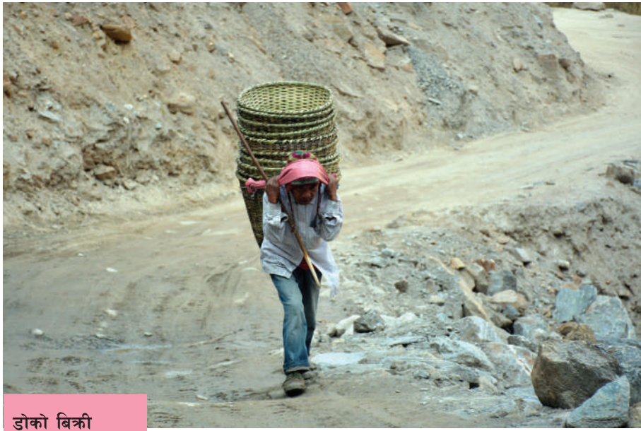
डोको बिक्री गर्न हिंडेका वृद्ध

ठ्याण्डीको अन्नपूर्ण गाउँपालिका-३, दानागा डोको बिक्रीका लागि हिंडेका वृद्ध ।